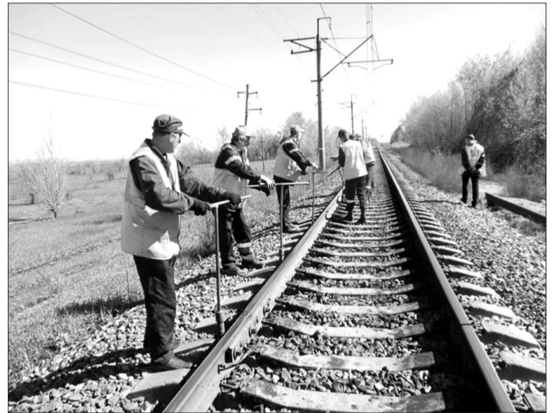
Закрепление клеммно-закладочных блоков на южном ходу бригадой мастеров пути.

В прошлом году выполнялся капитальный ремонт на участке от станции Безымянка до станции Кинель. Особое внимание уделяется содержанию железнодорожных переездов, расположенных в черте города Кинеля. Так, осенью на Сибирском