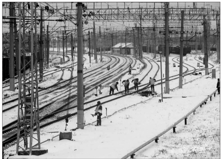
Снегоборьба на главном ходу станции Кинель. Путьцы очищают от снежных заносов железнодорожные стрелки.

переезде (северная сторона) был уложен новый пешеходный переход с использованием современного полимерного материала с нескользящим покрытием. В текущем сезоне ремонтных путевых работ новую пешеходную зону оборудуют на Ташкентском переезде (южная сторона). Также в этом году запланирован капитальный ремонт на старогондних материалах путей Безенчукского и парка № 8 станции Кинель.