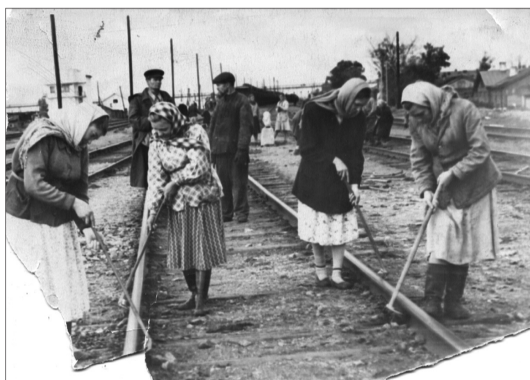
Трудовой день железнодорожников. На заднем плане - перекидной пешеходный мост, построенный в 1961 году.

Вдоль железной дороги, продолжает наша собеседница, находилась больница и амбулатория, где вели прием пациентов, проживающих на станции и в близлежащих поселениях. После войны заведовала ам-