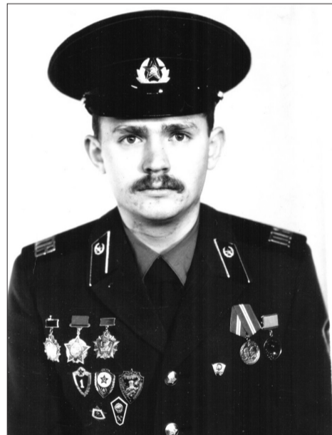
От службы в армии до службы в православном храме - путь в двадцать с лишним лет.