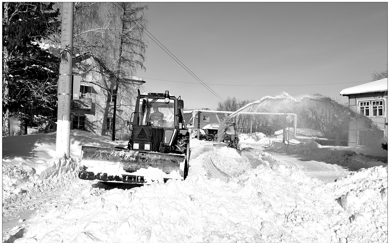
11 февраля в поселке Усть-Кинельский снегоуборочная техника работала на расширении дороги по улице Спортивная.

БОЛЬШЕ СОРОКА ЕДИНИЦ ТЕХНИКИ БЫЛО ЗАДЕЙСТВОВАНО НА ГОРОДСКИХ УЛИЦАХ ВО ВРЕМЯ БОЛЬШИХ СНЕГОПАДОВ