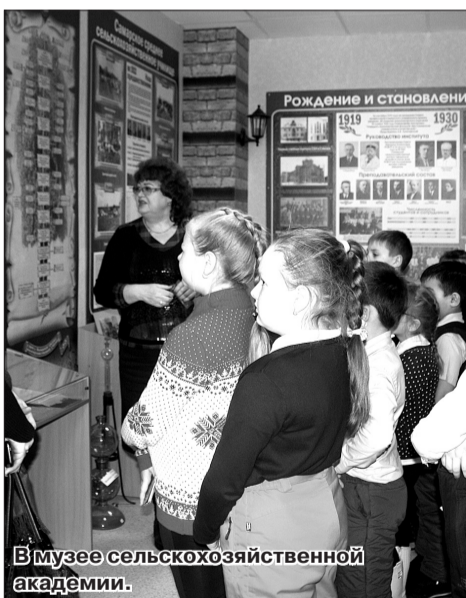
В музее сельскохозяйственной академии.

В составе Клуба православной молодежи «Преображение» они устраивают выездные представления кукольного театра для детей Самарской области, находящихся в трудной жизненной ситуации. По словам молодых сотрудников, своим творчеством они не только доставляют радость малышам, но и сами получают мощный позитивный заряд для продуктивной профессиональной деятельности.