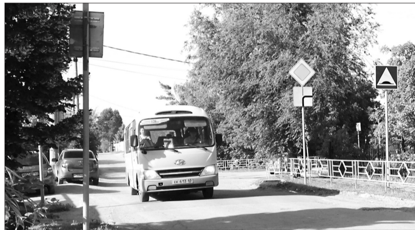
В Алексеевке по новой маршрутной карте общественный транспорт соединяет две части поселка.

Схема движения автобуса маршрута № 7 по Алексеевке меняется не первый раз. Ранее автобус уже ходил по улицам частного сектора, затем долгое время общественный транспорт охватывал только центр поселка - от главного въезда в Алексеевку (остановка у гостиницы «Звезда») до расположенного неподалеку жилого микрорайона (остановка у магазина «Южный»).