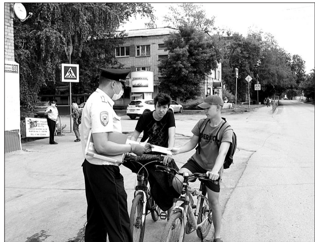
Подготовлено по информации, предоставленной отделением ГИБДД межмуниципального отдела МВД России «Кинельский».

Рейдовые мероприятия продолжатся до 30 июня. В них задействован личный состав Кинельского отделения ГИБДД во главе с руководителем подразделения. Привлечены к совместной работе участковые полици.