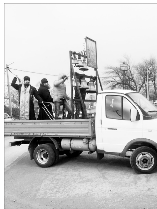
Колокольный звон - в помощь на преодоление сложной ситуации.