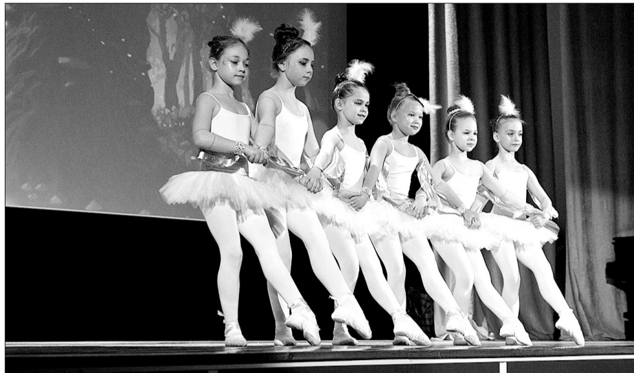
На сцене - Самарский музыкальный театр «Волшебное кольцо» с музыкальным спектаклем «Красная шапочка» и оперой для маленьких «Ку-ка-ре-ку».

В этом году во втором этапе фестиваля приняли участие ведущие детские творческие коллективы: более 260 юных актеров были задействованы в четырнадцати постановках. Самобытные театральные студии и ансамбли выступали в трех конкурсных номинациях: «Литературная или литературно-музыкальная композиция», «Драматический спектакль» и «Музыкальный спектакль». Выступления проходили на трех площадках. В Тольятти юных акте-