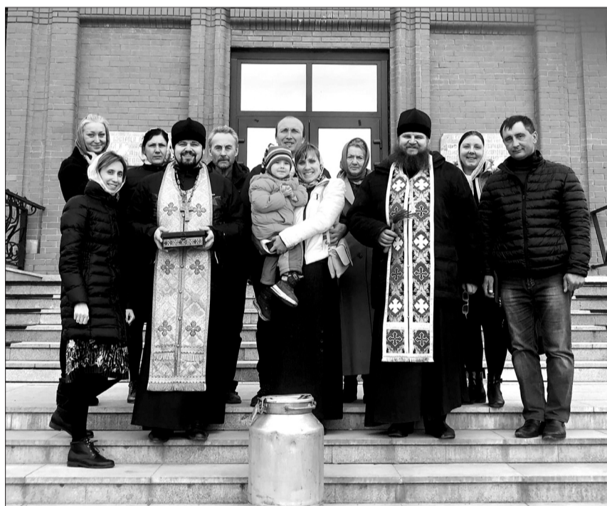
С ограниченным числом прихожан и соблюдая меры безопасности священнослужители провели крестный ход.

В целях предупреждения угрозы распространения новой инфекции управляющие компании проводят дезинфекцию подъездов многоквартирных домов. На фото - обработку лестничных пролетов выполняют специалисты управляющей компании «Евгриф».