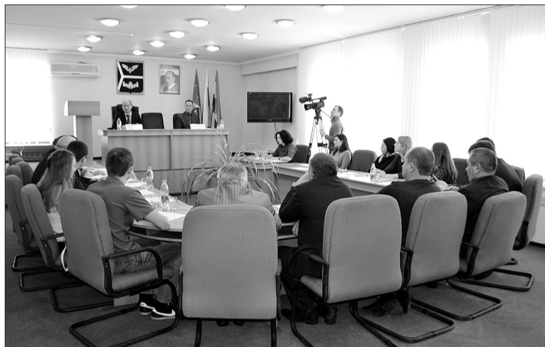
Итогом рассматриваемого в формате «круглого стола» вопроса стало решение о создании рабочей группы. Группа займется проработкой конкретных предложений для принятия муниципальной программы.

В обсуждении была затронута еще одна важная составляющая педагогического труда - участие учителей в профессиональных конкурсах. Отмечены самые активные школы № 2 и № 11, Образовательный центр «Лидер». Почему же в других городских учебных заведениях педагоги не особо проявляют интерес? Да потому как подготовка к конкурсным состязаниям - дело очень хлопотное, отнимает много времени, а его, при такой высокой ча-