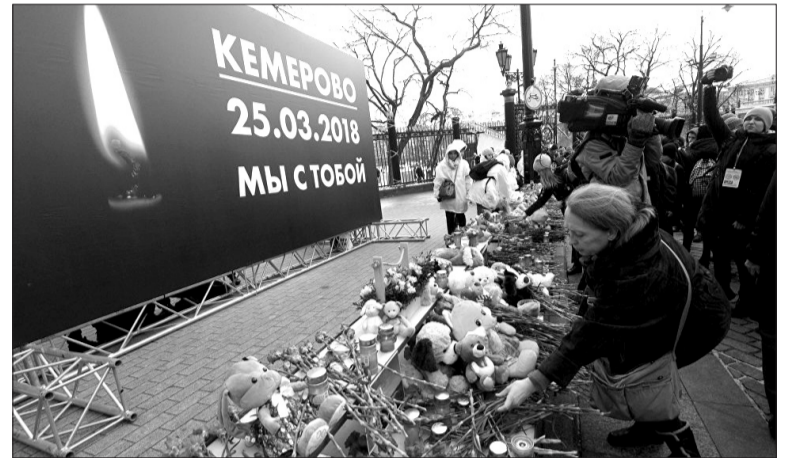
Народные акции памяти жертв трагедии прошли по всей стране.