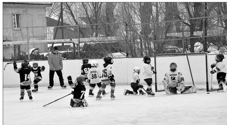
Шайба в воротах!