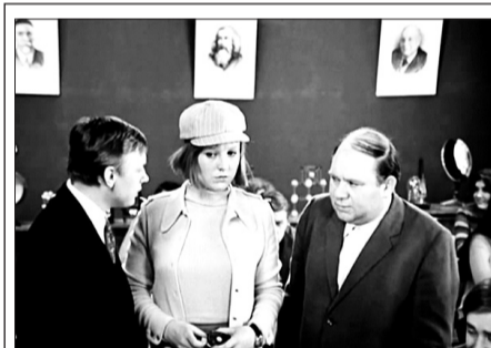
МИР Художественный фильм «Большая перемена» (12+)