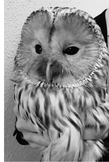
Эта птица - серьезного полета. Размах крыльев - 1,5 метра и очень красивое оперение.

А мы расспросили специалиста зоопарка об особенностях длиннохвостой неясыти. Оказывается, орнитологи отличают до