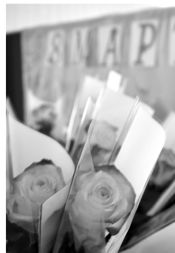
В прекрасный праздник весны - прекрасные цветы для всех участниц состязаний приготовили организаторы.