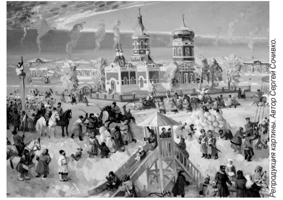
Репродукция картины. Автор Сергей Сочивко.

Добро пожаловать на Кинельскую Масленицу!