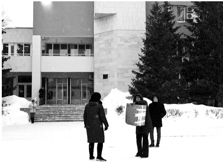
Высокие ели у здания городской администрации для совы - дом родной.

СПЕЦИАЛИСТЫ ПИТОМНИКА САМАРСКОГО ЗООПАРКА ПРИВЕЗЛИ ПТИЦУ К МЕСТУ ОБИТАНИЯ В ГОРОДСКОМ СКВЕРЕ