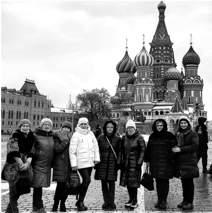
Находясь в столице Родины, невозможно не побывать в сердце Москвы и России.