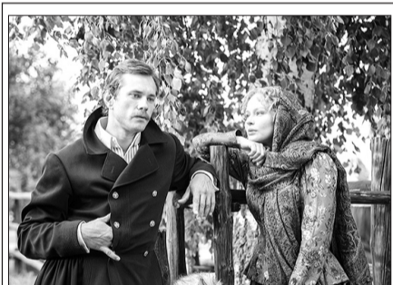
ПЕРВЫЙ КАНАЛ Телевизионный сериал «Угрюм-река» (12+)

ОТР 07.00, 01.30 Активная среда 12+ 07.30 Д/ф «Лебеди и тени Петипа» 12+ 08.25 Хит-микс RU.TV 12+ 09.15, 16.15 Календарь 12+ 10.10, 17.30, 04.40 Врачи 12+ 10.35, 17.10 Среда обитания 12+ 11.00, 13.00, 14.00, 16.00, 18.00, 19.00, 20.00, 21.00, 23.00 Новости 12+ 11.10, 23.05 Т/с «СТАНИЦА» 16+ 13.10, 14.20, 21.05, 02.00 Информационно-аналитическая программа «ОТРАЖЕНИЕ» 12+ 18.05 Т/с «ВЛЮБЛЕННЫЕ ЖЕНЩИНЫ» 16+ 20.20, 00.50, 04.00 «ПравДа?» 12+ 03.45 М/ф «Гора самоцветов» 0+ 05.05 «Домашние животные» 12+ 05.35 Легенды Крыма 12+ 06.05 Большая страна 12+