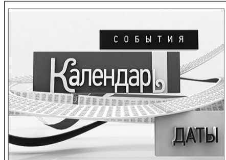
ОТР Информационная программа «Календарь» (12+)