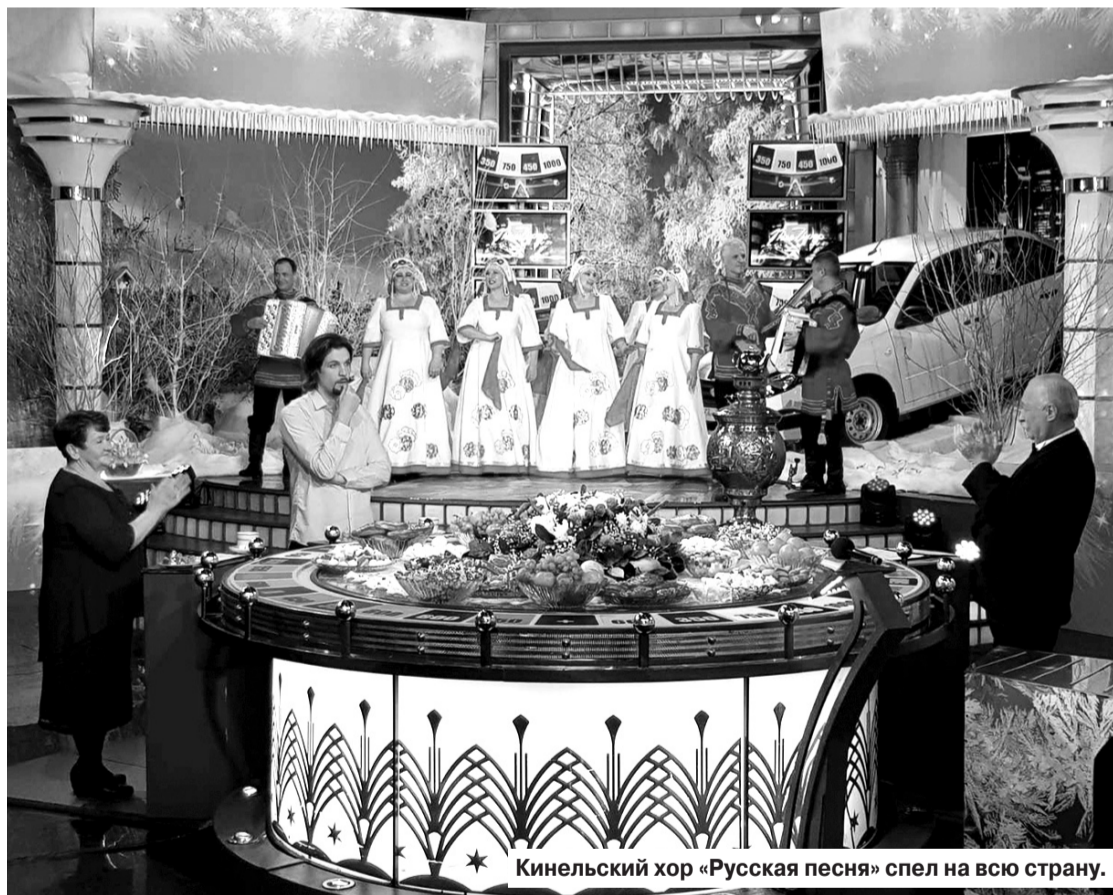
Кинельский хор «Русская песня» спел на всю страну.

«Добрый вечер! Здравствуйте, уважаемые дамы и господа! В эфире - капитал-шоу «Поле Чудес» - с этого приветствия уже больше тридцати лет начинается самая известная программа российского телевидения. До сих пор передача собирает у телеэкранов постоянных зрителей. Для одних - интересно в очередной раз познакомиться с географией участников игры, для других - попытаться разгадать скрытое за квадратиками табло слово, да и просто провести пятничный вечер в теплой компании обаятельного и бессменного ведущего.