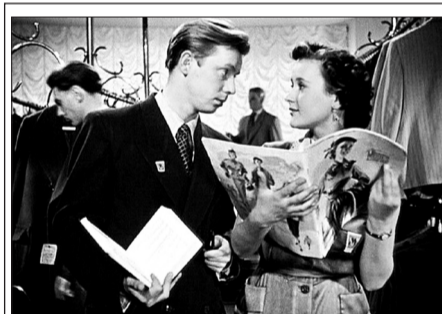
ТВ ЦЕНТР Художественный фильм «За витриной универмага» (12+)