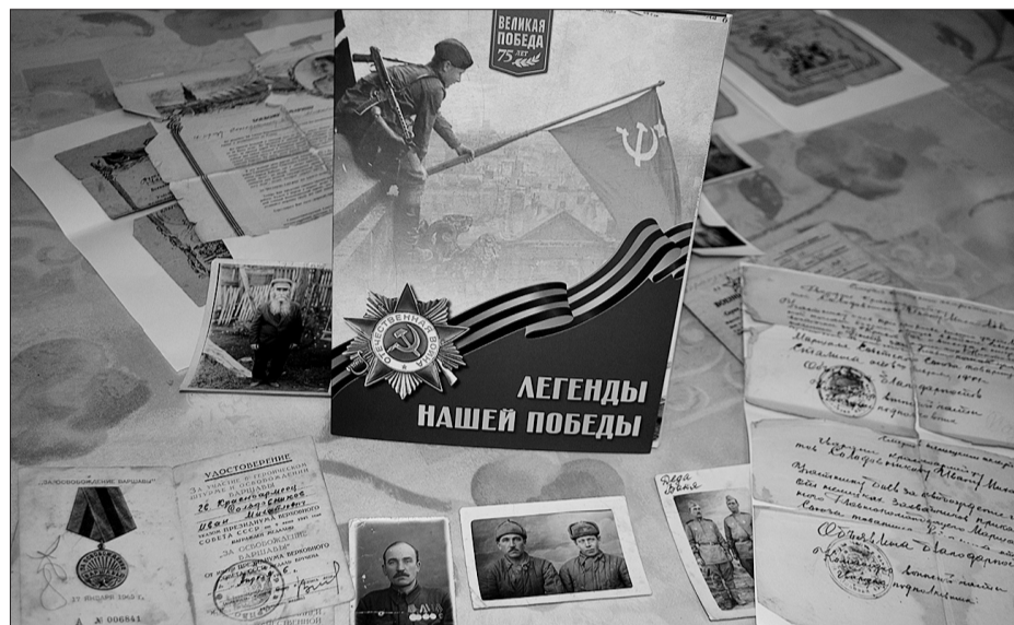
Летопись фронтовых судеб стала бесценной реликвией для наследников Победы.

О ТРЕХ ГЕРОЯХ В СЕМЕЙНОМ АРХИВЕ СОБРАНЫ ДОКУМЕНТЫ, НАГРАДНЫЕ ЛИСТЫ ВОЕННОГО ВРЕМЕНИ