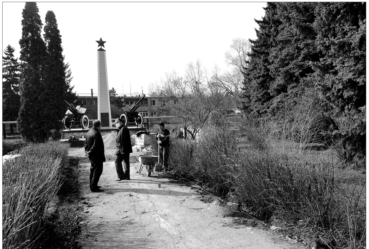
К юбилею Победы обелиск в поселке Усть-Кинельский и прилегающая территория получат обновление.

В связи со сложившейся обстановкой и с целью недопущения распространения коронавирусной инфекции справки о составе семьи можно получить ежедневно (суббота и воскресенье - выходные дни) с 8 до 17 часов, по адресу: г. Кинель, ул. Мира, 42 «а» (во дворе здания администрации городского округа Кинель). Выдача справок проводится строго по предварительной записи по телефонам: 8(84663) 6-30-48, 2-14-14.