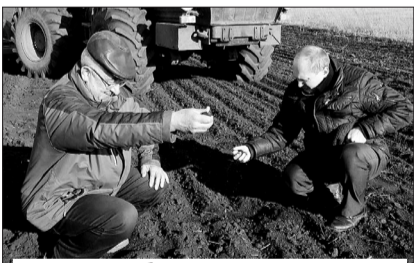
На полях учебного хозяйства агроуза.

В Поволжском научно-исследовательском институте селекции и семеноводства имени П. Н. Константинова также находятся на старте полевых работ. Перед тем как приступить к новому сельскохозяйственному сезону, всю технику подготовили к прохождению технического осмотра.