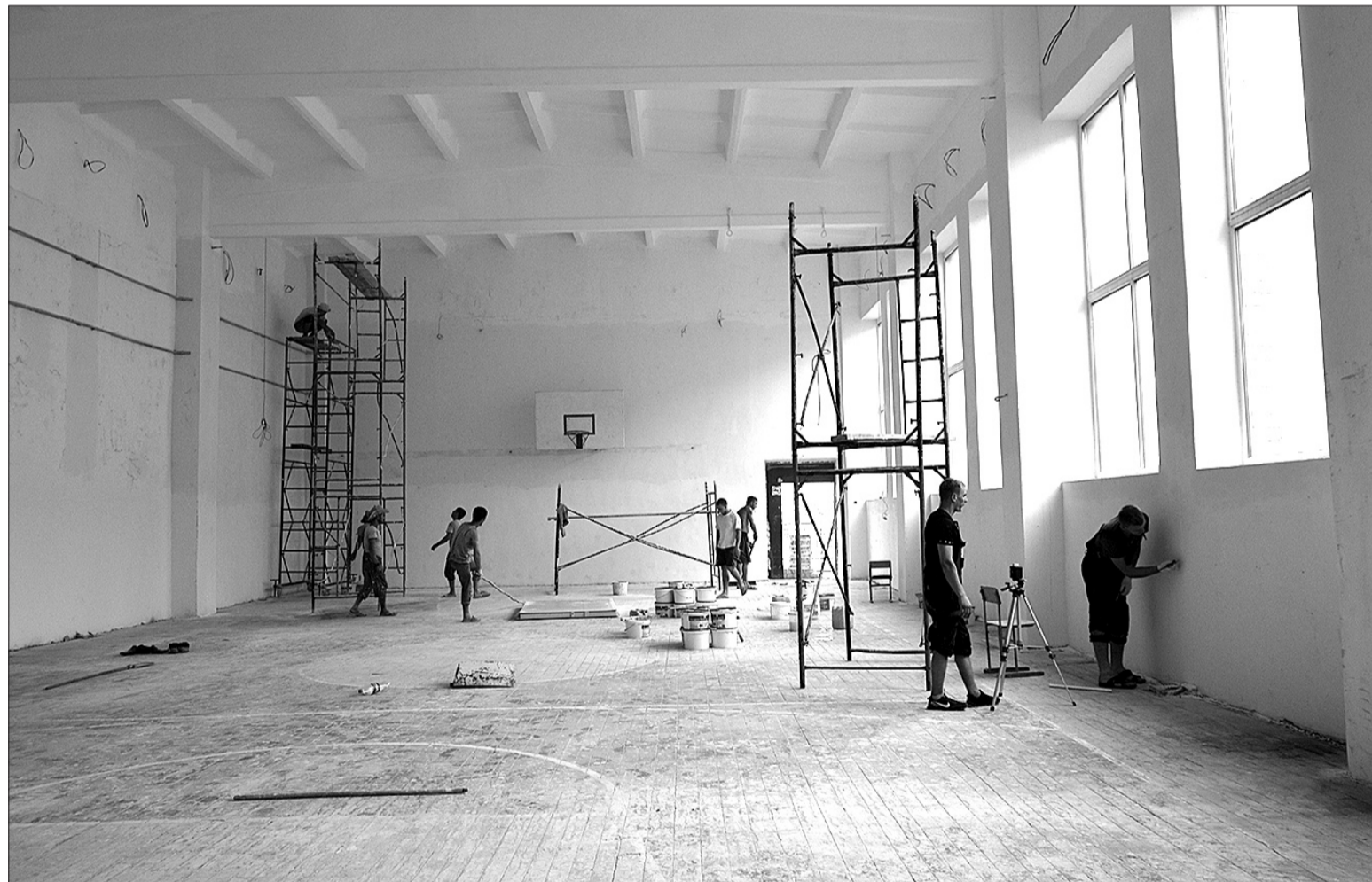
Обновленный спортивный зал в школе № 1 - для активных занятий на любимых учениками уроках физкультуры.

ДО НАЧАЛА НОВОГО УЧЕБНОГО ГОДА - ДВЕ НЕДЕЛИ