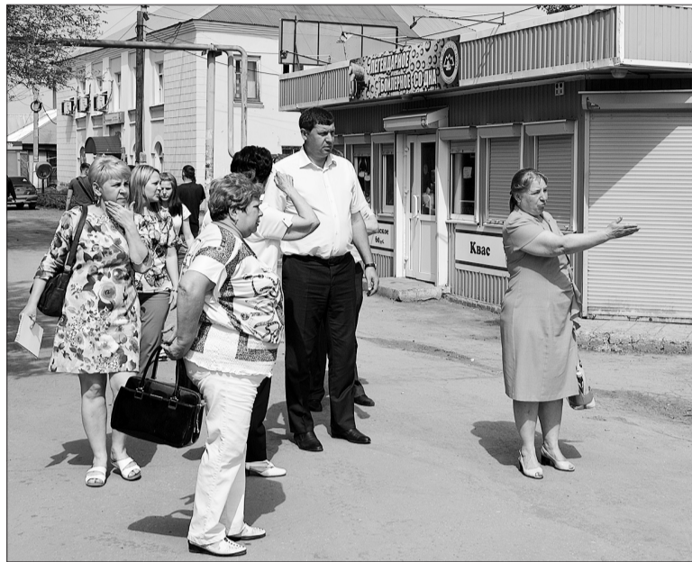
Вопросы по северной стороне, которые общественники подняли в мае, остаются у них на контроле.

На заседании общественники подвели итоги своего рейда, проведенного совместно с руководителями и сотрудниками подразделений администрации, депутатами Кинельской Думы. Картина тогда сложилась далеко не положительная. Итогом предметного разговора по устранению выявленных недостатков стало решение, принятое Общественной палатой, с конкретными рекомендациями службам муниципалитета. Внимание общественников было обращено и на усиление работы административной комиссии в части наведения санитарного порядка и выполнения норм благоустройства. Административной комиссии в решении Общественной палаты было записано: «активизировать контроль за уборкой территории, прилегающей к зданиям, занимаемыми предприятиями, учреждениями, в том числе организациями торговли, бытового обслуживания, общественного питания, частными домовладениями». Через