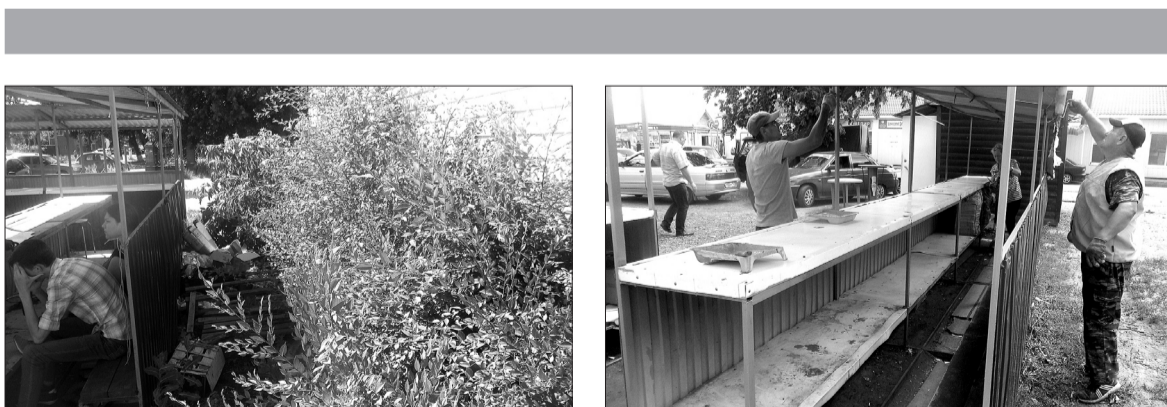
Шаги к изменению сделаны: от того, что было, и как ситуация исправлена.