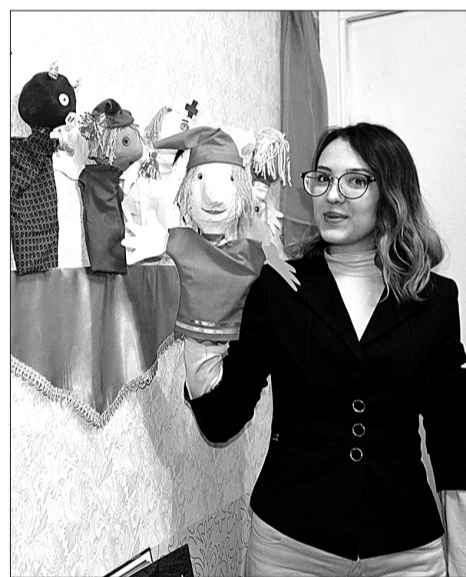
Авторами этих забавных театраль-ных кукол стали дети. В творческой работе им помогла библиотекарь М. А. Нестерова.

вили обрядовых кукол, испекли жаворонков: этих вестников весны теперь уже мало кто помнит, как выпекать. На Масленицу читатели наготовили блинов по индивидуальным рецептам, а потом за чаепитием в библиотеке угощали друг друга.