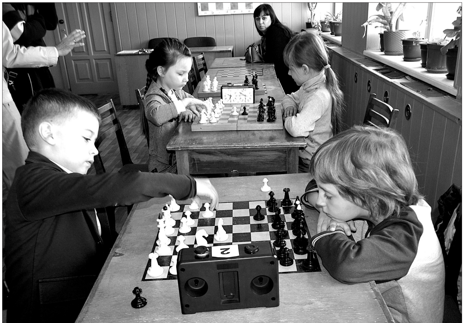
Двойной дебют: у турнира и для участников. Впервые за черно-белыми фигурами в городском шахматном клубе - воспитанники детских садов.

В СПОРТИВНОМ ЦЕНТРЕ «КИНЕЛЬ» ПРОШЕЛ ШАХМАТНЫЙ ТУРНИР СРЕДИ ДОШКОЛЬНИКОВ