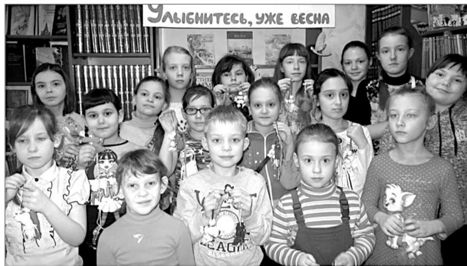
Библиотекари развивают познавательный интерес юных читателей, знакомят с народными традициями. На фото - участники мастер-класса по изготовлению обрядовой куклы «Мартеничка».