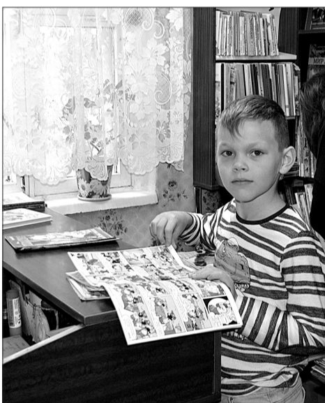
Для ребят двери библиотеки будут открыты в течение всех летних каникул, и интересные встречи продолжатся.