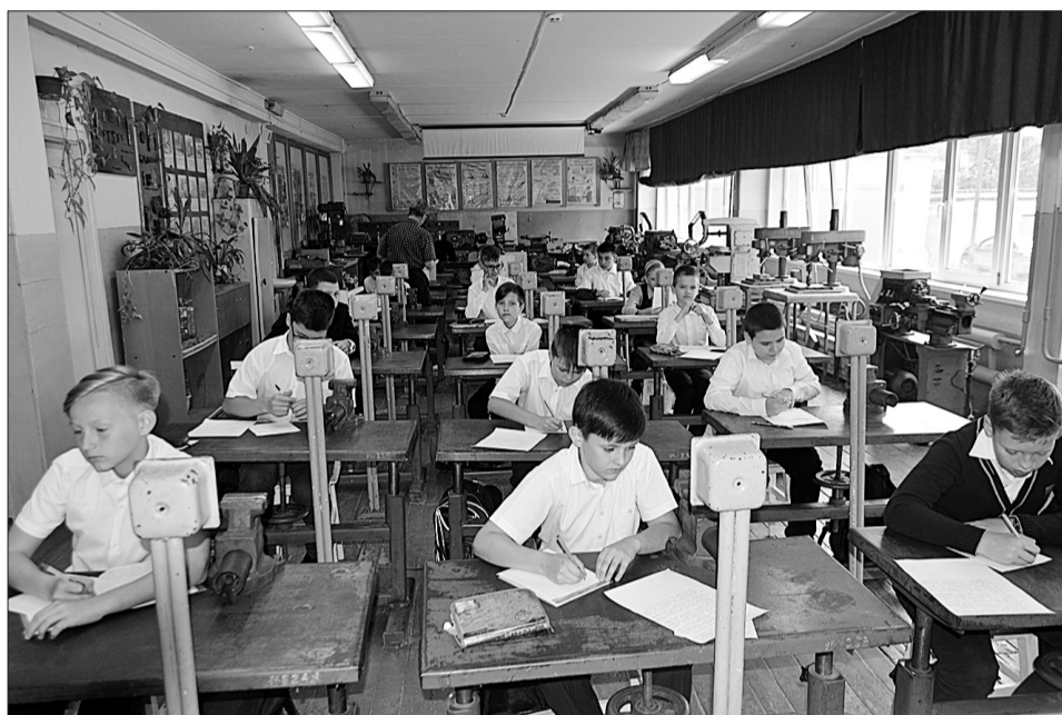
На контрольной работе по технологии ученики пятого класса сосредоточены: вопросы заданий не из легких.

Задача школы - выпустить из своих стен готового к самостоятельной жизни человека. На уроках технологии ребенок учится на практике применять знания, полученные по образовательным предметам. Я учу детей строгать пилить, гвоздь прибить, шуруп ввернуть, водопроводный кран починить, отремонтировать электротехнику. Мужское дело - иметь элементарные бытовые навыки. С другой стороны - это профориентация для будущей инженерной или рабочей специальности».