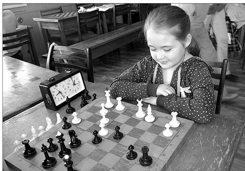
Сделать правильный ход - задача не из простых.

«Ребятам шахматы нравятся. С удовольствием идут на занятия. Все новое для такого возраста ин-