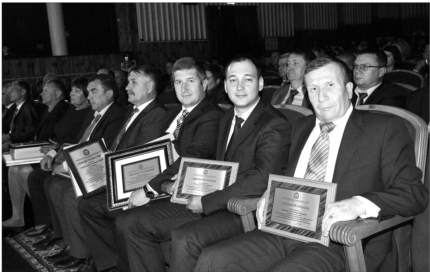
Заслуженные награды в руках глав муниципальных образований - результат совместной работы власти и населения.

В КИНЕЛЕ ПРОШЛА ЦЕРЕМОНИЯ НАГРАЖДЕНИЯ ПОБЕДИТЕЛЕЙ КОНКУРСА НА САМЫЙ БЛАГОУСТРОЕННЫЙ МУНИЦИПАЛИТЕТ ГУБЕРНИИ