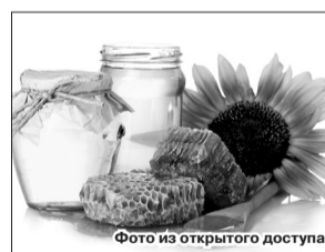
Фото из открытого доступа.

Именины в этот день: Алексей, Гавриил, Георгий, Давид, Зосима, Игорь, Константин, Макар, Мария, Николай, Трофим, Федор.