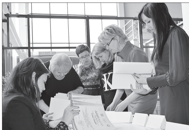
Жюри подвело итоги творческого конкурса, результаты которого были объявлены в ходе награждения.