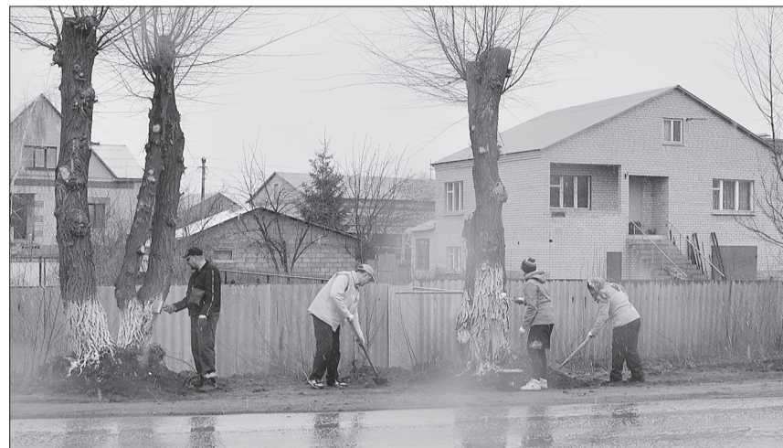
В период весенней уборки улица Светлая закреплена за вагонным эксплуатационным депо.

Порядок после зимы на улице Партизанская наводили работники станции. Десять человек, «откомандированных» на уборку, трудились дружно: очищали территорию от мусора, производили опилку старых кустарников.