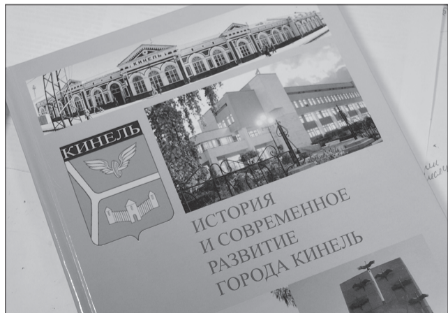
Официальные символы городского округа Кинель - флаг и герб - дополнит в скором времени гимн.

Творческий конкурс по созданию бренда городского округа был приурочен к 180-летию Кинеля, и чествование победителей состоится в августе, на торжестве, посвященном юбилею города.