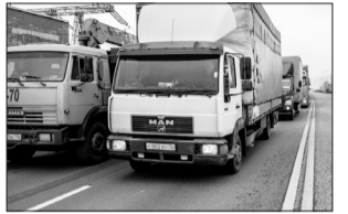
Движение большегрузов на федеральных магистралях в границах Самарского региона ограничат по тоннажу.

Как сообщается на сайте Правительства Самарской области, данная мера вводится в целях обеспечения безопасности дорожного движения в связи с выявленными дефектами и повреждениями конструктивных элементов. Сроки действия ограничения установлены согласно программы по ремонту искусственных сооружений.