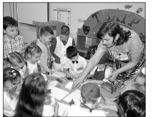
Эра роботов в системе образования наступит еще не скоро.

Ранее ученые Высшей школы экономики составили список профессий, которые первыми исчезнут с рынка труда, уступив место роботам. В него попали, к примеру, разделщики мяса и рыбы, сборщики электромеханического оборудования, технические специалисты по геологии, технические специалисты по медицинским картам и записям. Вероятность исчезновения всех перечисленных профессий ученые оценили в диапазоне от 0,91 до 0,99. А вот шансы на исчезновение профессий гидрологов, руководителей, учителей, следователей полиции и социальных работников чрезвычайно низки. Вероятность их исчезновения с рынка труда оценивается в десятичных долях, от 0,0014 до 0,0044. То есть в ближайшем будущем машина этих специалистов не заменит.