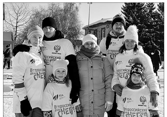
После зимнего праздника в Кинеле семьи из города Жигулевска домой возвращались с хорошим настроением.