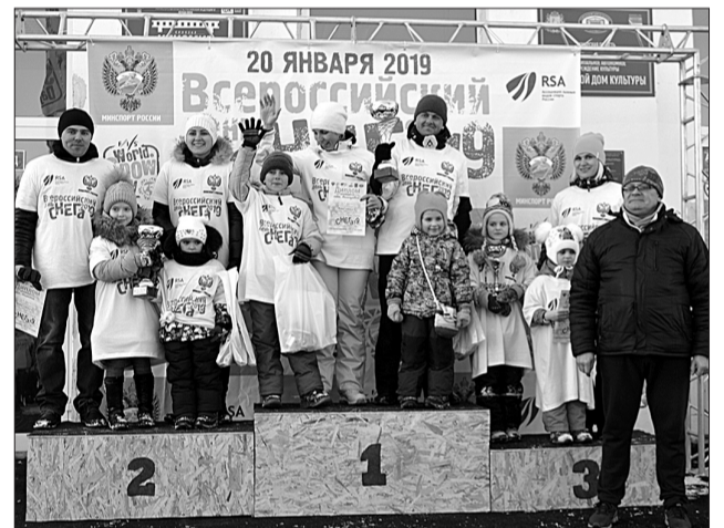
Восторга и радости от побед у взрослых было не меньше, чем у детей. На спортивный пьедестал поднялись лучшие семейные команды, которые показали хорошие результаты в соревнованиях большой программы снежного праздника.