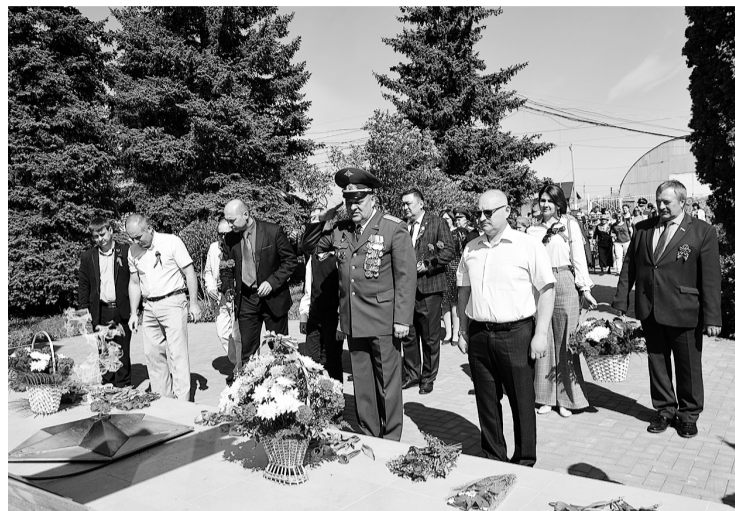
Цветы весны и Победы в праздничный день приносили усть-кинельцы к подножию обелиска и Вечному огню.