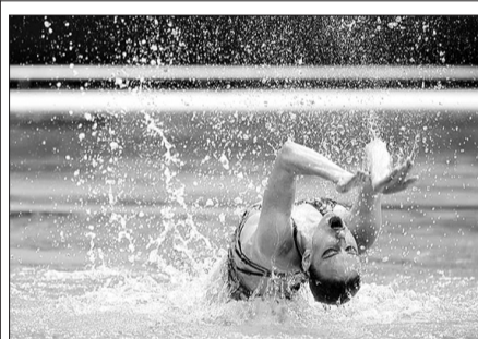
МАТЧ Чемпионат Европы по водным видам спорта (0+)