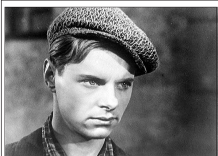
ТВ ЦЕНТР Документальный фильм «Леонид Харитонов. Отвергнутый кумир» (12+)

ОТР 07.00 Активная среда 12+ 07.30 М/ф «Гора самоцветов» 6+ 07.45 Х/ф «СЕРДЦА ЧЕТЫРЕХ» 12+ 09.15, 16.15 Календарь 12+ 10.10, 17.30 Врачи 12+ 10.35, 17.10 Среда обитания 12+ 11.00, 13.00, 14.00, 16.00, 18.00, 19.00, 20.00, 21.00, 23.00 Новости 12+ 11.10, 18.30, 19.05 Х/ф «С ЛЮБИМЫМИ НЕ РАССТАВАЙТЕСЬ» 16+ 12.30 Вспомнить все 12+ 13.10, 14.20, 18.05, 21.05 Моя история 12+ 20.20 «Прав! Да?» 12+ 23.05 Х/ф «ДУРАК» 16+ 01.05 За дело! 12+