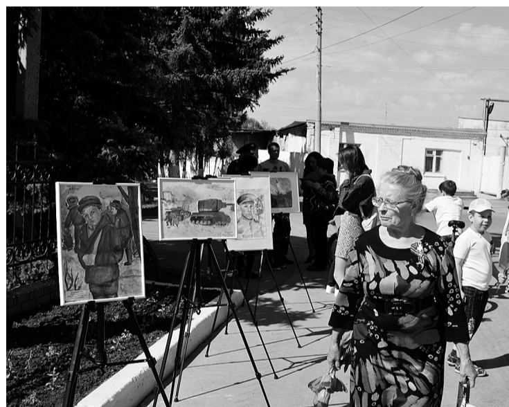
Свое отношение к теме войны выразили в художественных работах учащиеся школы искусств.