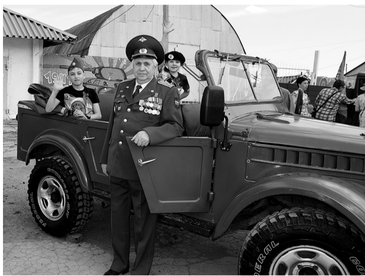
Особое настроение в праздничную палитру добавили автомобили военной поры, которые проехали девятого мая по улицам поселка.