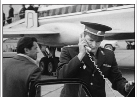
ЗВЕЗДА Художественный фильм «Огарева, 6» (12+)