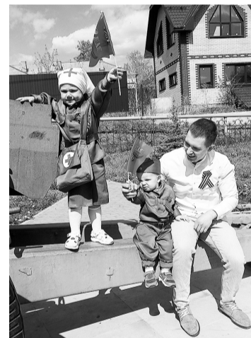
Алексеевцы семьями приходили к обелиску. Во дворах девятого мая звучали песни праздника.