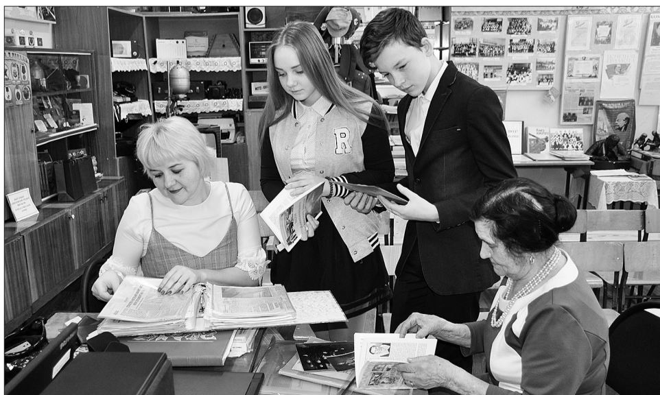
В музее школы № 8 хранятся свидетельства участников исторических для нашей страны событий.