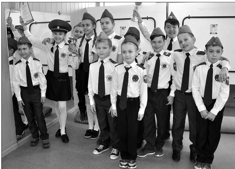
Троекратные победители «Зарницы» в младшей группе - сборная школы № 5.

А вот для старшей группы задания были сложнее, на уровне начальной военной подготов-