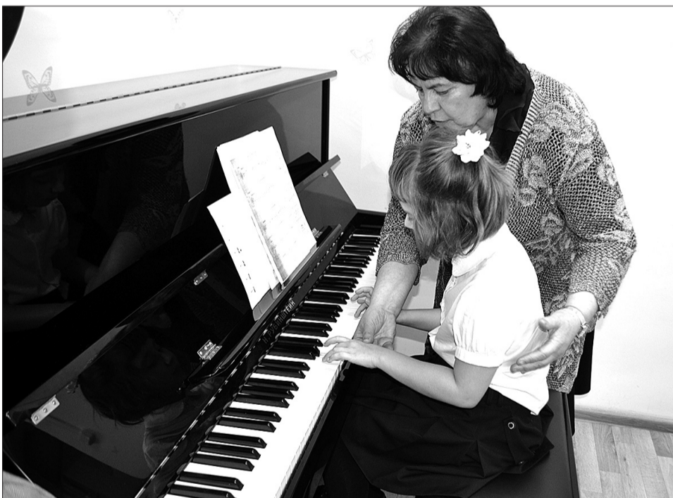
Национальный проект «Культура» в Кинеле: поставка музыкального инструмента в Детскую школу искусств № 2.