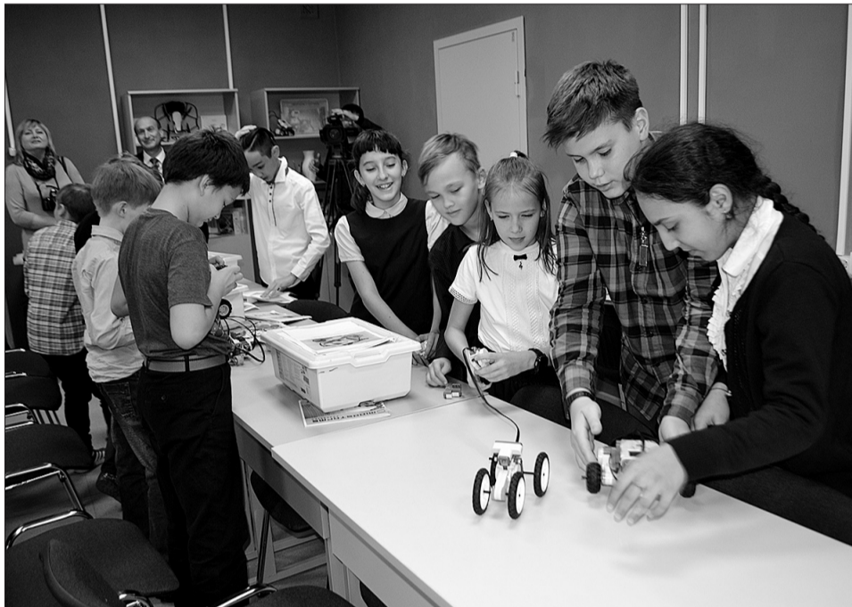
Национальный проект «Образование» в Кинеле: Центр образования цифрового и гуманитарного профилей «Точка роста» открылся в школе № 8 с нового учебного года.