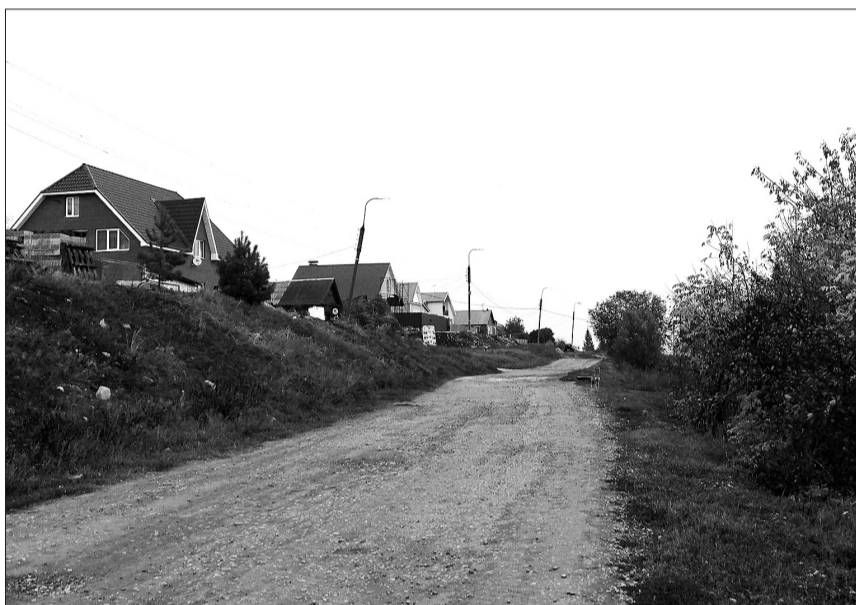
Улица Вокзальная, где вопрос о ремонте водовода стоит не первый год. Жители этой части поселка Алексеевка предлагают выполнение реставрации инженерных сетей представить в проекте для участия в региональной программе «Содействие».

Следующий в перечне актуальных - вопрос о транспортном сообщении, конкретно - изменение пути следования автобуса № 7, маршрут которого пролегает из Алексеевки в центр города Кинель. Этот маршрут неоднократно менялся, и многие жители отмечают: для них было бы удобнее, если «семерка» проследует от конечной остановки - через поселок, по улицам Советская и Зазина. Благо, в текущем году здесь проводились работы по ремонту дорожного полотна. Эта тема также остается на контроле у общественников, предложено на ближайшие заседания Совета пригласить представителя компании-перевозчика.