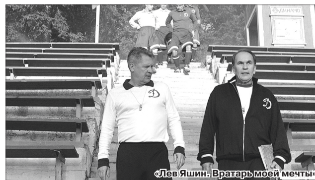
«Лев Яшин. Вратарь моей мечты»