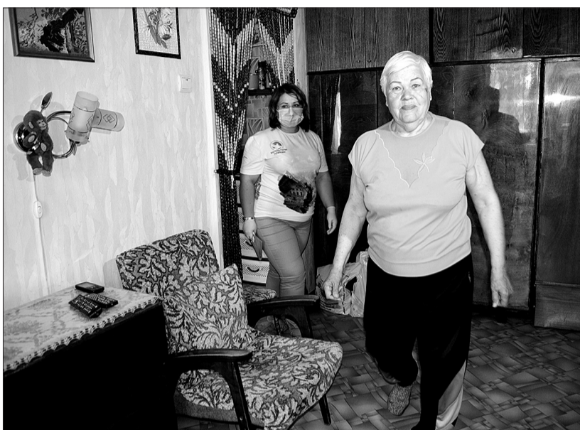
Для пожилых людей участие в их жизни волонтеров сейчас необходимо и ценно.

В составе наборов - самое необходимое. «Мы исходили из потребностей людей старшего возраста, - поясняет руководитель ООО «Молочный мир». - На их столе обязательно должны быть молоко, кисломолочная продукция, творог, сметана. Добавили и йогурты, творожные десерты, всего более десяти позиций. Для нас это возможность поддержать людей, и мы делаем это от чистого сердца».