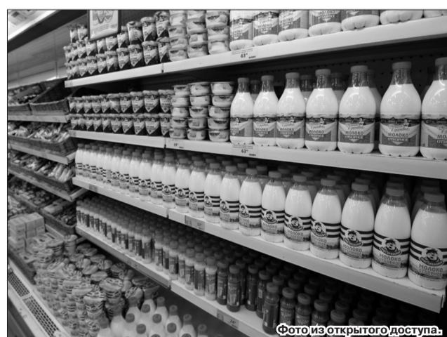
С товарным знаком продукция самарских производителей на витринах и прилавках станет заметнее.

Ознакомиться с более подробной информацией о присвоении региональной символики можно на официальном сайте министерства промышленности и торговли Самарской области https://minprom.samregion.ru (в разделе «Торговля и потребительский рынок - Региональный товарный знак»).