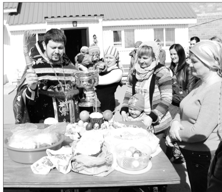
Освящение куличей - вековая традиция праздника.

шего он встречал со словами: «Радость моя, Христос Воскресе!» И Пасха для нас - несокрушимая вера в победу жизни над смертью, добра над злом. И свершилась она не на небесах, а здесь - на земле.