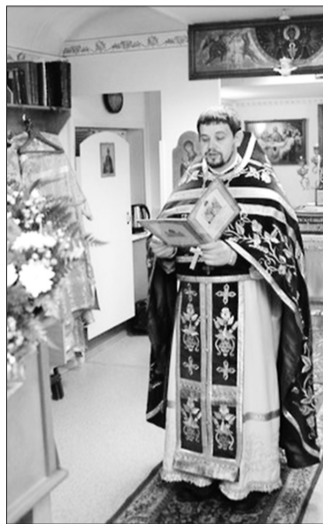
Идет служба в честь Воскресения Христова.

Но на самом деле, Пасха с нами всегда, ведь человек верующий живет с Христом. Спаситель оставил нам две заповеди. Первая - возлюби Господа Бога твоего всем сердцем твоим. Вторая - ей подобная: возлюби ближнего твоего, как самого себя. Тот, кто им следует, не отпускает пасхальную радость из сердца никогда. Вспомним житие Серафима Саровского, который жил рядом с нами, - в Поволжье. Каждого пришед-