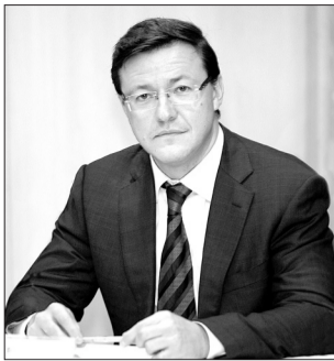
ВРЕМЕННО ИСПОЛНЯЮЩИЙ ОБЯЗАННОСТИ ГУБЕРНАТОРА САМАРСКОЙ ОБЛАСТИ Д. И. АЗАРОВ.