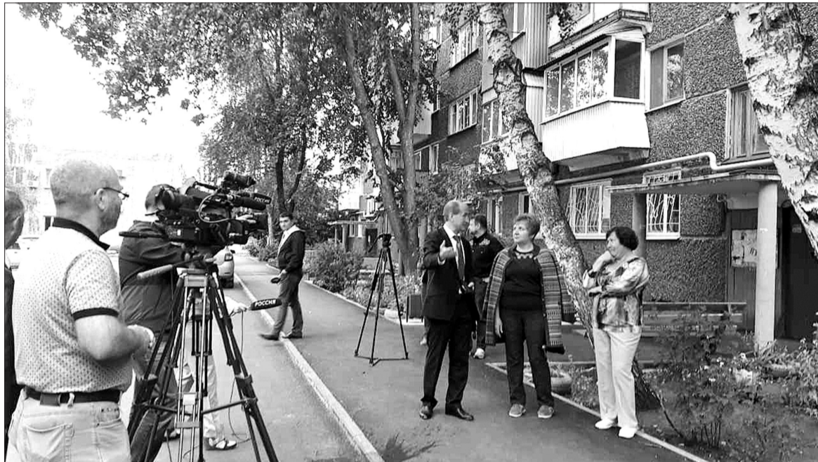
Глава городского округа вместе с общественниками дома № 90 по улице Маяковского показал журналистам выполненный объем работ по нацпроекту.

ЖУРНАЛИСТЫ ОБЛАСТНЫХ ПЕЧАТНЫХ ИЗДАНИЙ И ТЕЛЕКАНАЛОВ УВИДЕЛИ, КАК РЕАЛИЗУЮТСЯ ПРОЕКТЫ БЛАГОУСТРОЙСТВА НА ТЕРРИТОРИИ ГОРОДСКОГО ОКРУГА