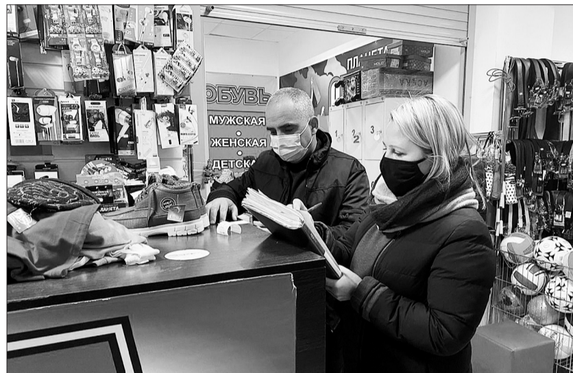
В городе Кинеле с рейдовыми мероприятиями сотрудники администрации и отдела полиции вышли в торговый центр «МН», магазин «Семья», сетевой супермаркет «Семейный магнит».

В ходе рейдов было засвидетельствовано - жители понимают, что не-