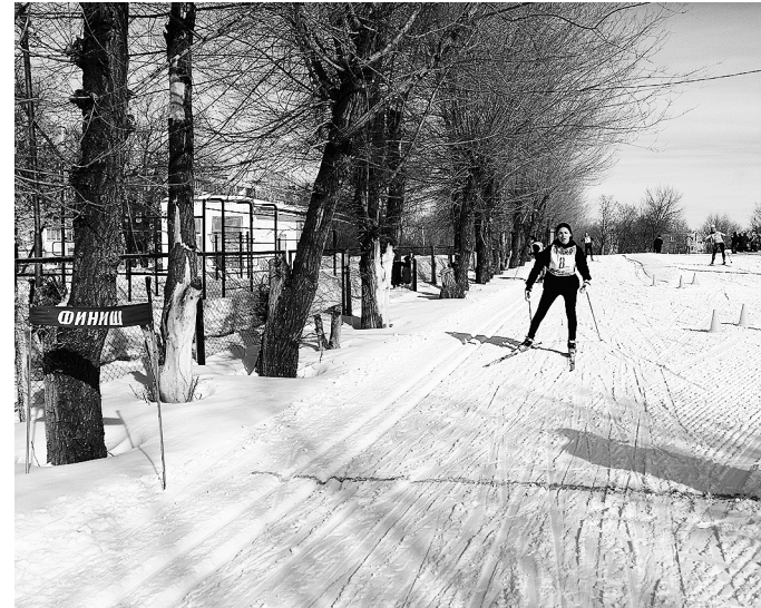
... и - всего несколько метров до финиша.

друг с другом. Но чувствуется волнение, каждый понимает: нужно показать хороший результат, который пойдет в общую командную копилку. Школьные учителя физкультуры, тренеры - рядом, чтобы дать ребятам последние наставления перед забегом.