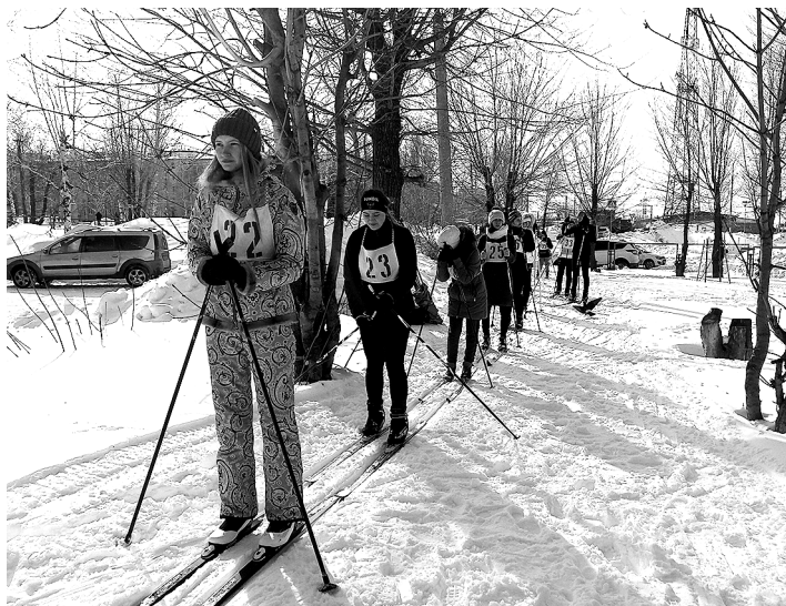
В ожидании своего старта...

НА ЛЫЖНОМ ПЕРВЕНСТВЕ ОПРЕДЕЛИЛАСЬ СИЛЬНЕЙШАЯ ШКОЛЬНАЯ КОМАНДА В ИСКОННО РОССИЙСКОМ ВИДЕ СПОРТА