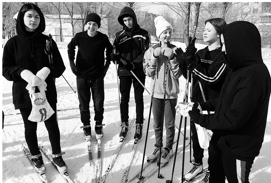
Настроение перед стартом и после финиша - спортивное.