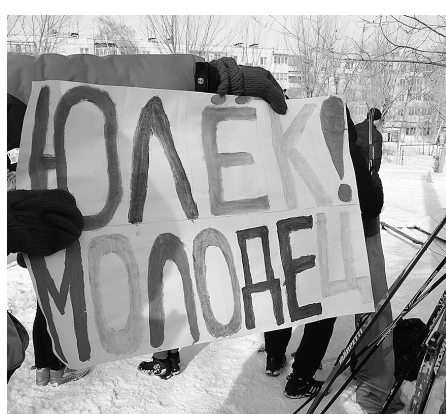
Болельщики к соревнованиям подготавливались. В поддержку своих спортсменов развернули красочные плакаты.

Таких «звездочек» видно с первых тренировок - они трудолюбивые, готовы работать каждый день и в любую погоду. Но главное, они по-настоящему любят лыжный спорт. Ведь как бывает: многие ребята приходят в лыжную секцию, думая, что это легко. И это на первый взгляд так: спортсмены бегут по лыжне, словно в танце. А на практике оказывается, что это огромный труд. Причем, нужно не только мышцы тренировать, но и ум. Часто от решений спортсмена, от выбранной тактики зависит победа всей команды. Сегодня результатом доволен, ребята не подвели. Все - настоящие молодцы».