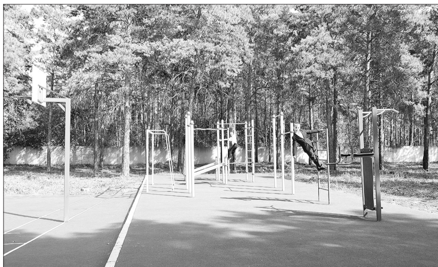
Спортивная площадка у начальной школы в поселке Усть-Кинельский.

Информация предоставлена Кинельским территориальным отделом филиала Федеральной Кадастровой палаты по Самарской области.