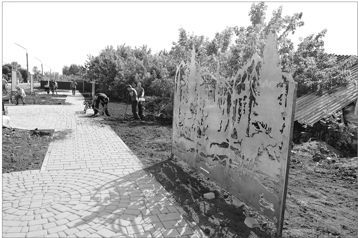
Создаваемый на северной стороне города сквер - один из проектов общественных территорий.

СЕЗОН БЛАГОУСТРОЙСТВА В ГОРОДСКОМ ОКРУГЕ КИНЕЛЬ ЗАВЕРШАЕТСЯ ВЫПОЛНЕНИЕМ РАБОТ В РАМКАХ ПРИОРИТЕТНЫХ ПРОГРАММ