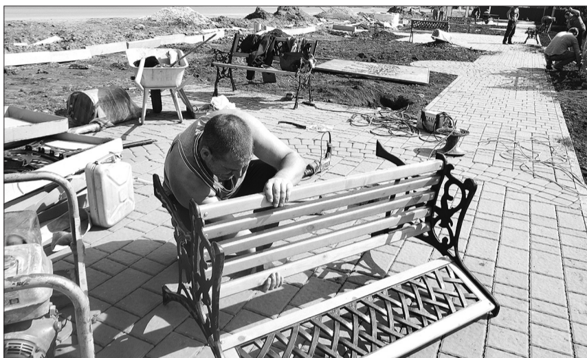
«Ажурный узор» лавочек - дополнение в красоту зоны отдыха.

Что и говорить, открытие сквера «Сказка», такое он получил название, - событие далеко неординарное. Здесь ничего не делалось для отписки и галочки: мол, вы просили, мы сделали, что смогли. Не «что смогли», а о чем жители раньше и не мечтали. Сотрудники ООО «Берсо» для кинельцев создали индивидуальный проект, он - в единственном экземпляре.