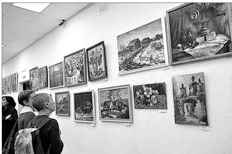
Каждый из посетивших выставку в день ее открытия нашел «близкую» для себя картину.