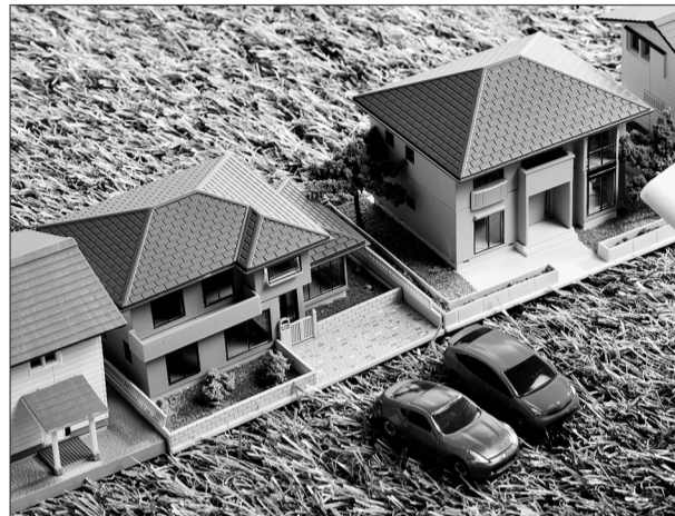
Срок уплаты имущественных налогов (недвижимость, земля, транспорт) - 1 декабря текущего года.

Именины в этот день: Андрей, Василий, Виталий, Владислав, Галактион, Давид, Павел, Сергей, Спиридон, Степан, Фекла.