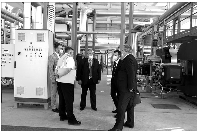
Энергоёмкость установленного оборудования в несколько раз выше, чем в прежних паровых котлах.