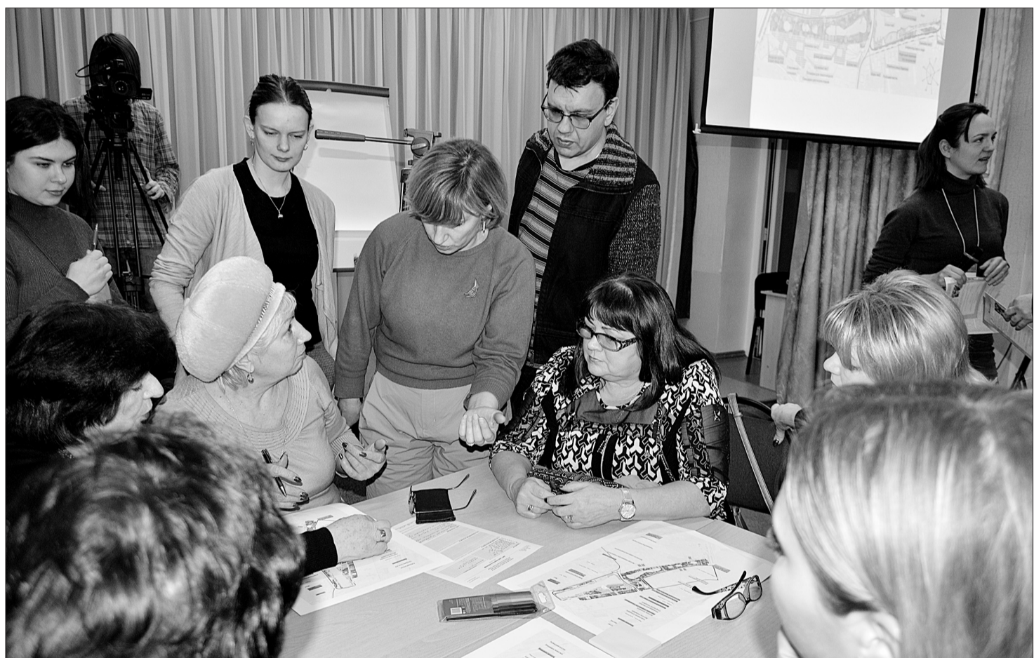
Как и на первой встрече, обсуждение представленного проекта благоустройства проходило активно.

Актовый зал 2-го корпуса школы № 11 (бывшая школа-интернат № 9 ОАО «РЖД») в последний день февраля вновь заполнился людьми разных возрастов и занятий. Ровно месяц назад, 28 января, здесь состоялось открытое обсуждение с участием жителей вопросов благоустройства общественных пространств городского округа Кинель.