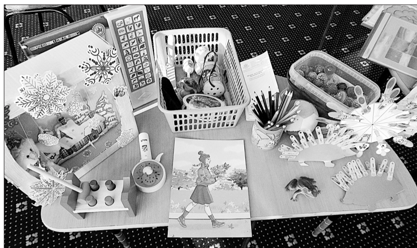
Логопеды дошкольного образования подготовили выставку оборудования и дидактического материала, необходимого для речевого развития ребенка в домашних условиях.

Логопеды детского сада «Сказка» убедили собравшихся родителей в том, что любые серьезные проблемы можно решить, если вовремя помочь малышу, постоянно использовать все способы развития и активизации речи. Работа с ребенком с задержкой речи будет пронизывать каждый вид его деятельности, и такая работа должна