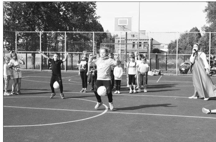
Подвижные игры, спортивные состязания собрали большое число участников. Площадки в День города не пустовали.