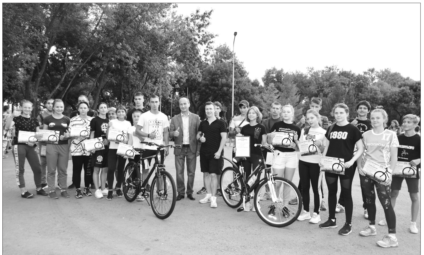
Финалисты праздничной акции «Отожми велосипед» с главой Кинеля В. А. Чихиревым.

ГОРОД КИНЕЛЬ ОТМЕТИЛ 183-Ю ГОДОВЩИНУ СО ВРЕМЕНИ ОСНОВАНИЯ