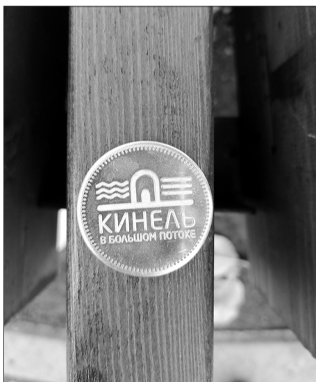
Многие участники конкурсных программ решили не менять монетки на призы, а оставить их себе в качестве сувенира и на память о необычном, но таком замечательном Дне города.