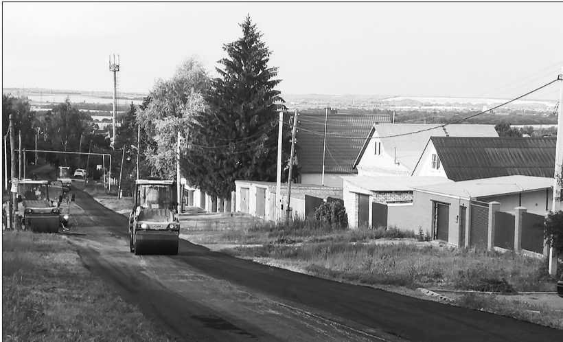
Дорожное полотно на улице Чапаевская, что находится в частном секторе, в этом сезоне благоустройства покрывают новым асфальтом.

В Алексеевке ремонт дорожного полотна проводится одновременно по трем адресам. Продолжается обновление центральной дороги, расположенной в квартале многоквартирных