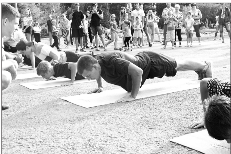
На финишном соревновании за велосипед отжимались не просто со спортивным азартом, чтобы победить, а еще и с хорошим праздничным настроением.

За время проведения конкурса более 600 юных кинельцев становились его участниками и 200 из них были удостоены звания лауреата. В этом году в комиссию поступило 38 представлений. 12 ребят получили главные награды из рук главы городского округа Кинель - Благодарственное письмо и сертификат на денежную премию.