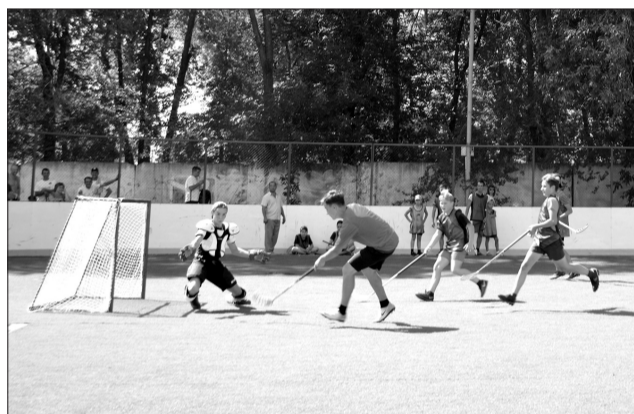
Настоящие хоккеисты и на зеленом поле умеют владеть клюшкой.