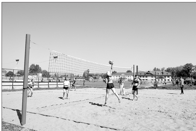
Соревнования по пляжному волейболу вошли в городской календарь спортивных турниров.