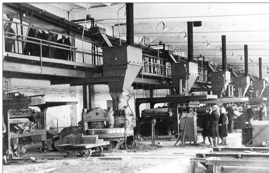
Прессовое отделение предприятия: полвека назад (на верхнем снимке) и сегодня.

Еще один несомненный плюс в том, что силикатный кирпич - материал экологически чистый. Составляющие в нем известь, песок и вода. Песок, кстати, добывают здесь же - в алексеевском карьере. Известь