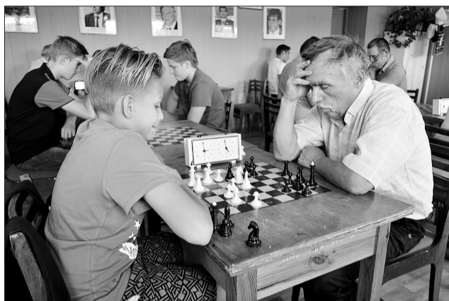
Непростыми для мастеров игры оказались партии с юными участниками шахматного турнира.

«В областных соревнованиях по шашкам в Самаре участвовал три раза, имею неплохие результа-