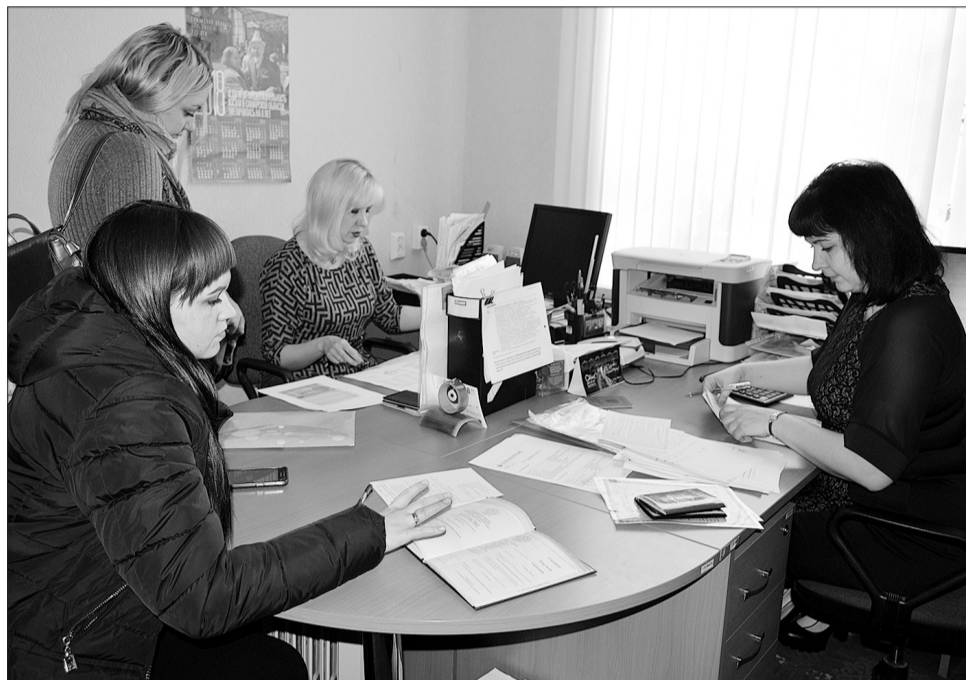
Специалисты управления социальной защиты населения окажут всю консультационную помощь в оформлении выплаты при рождении первого ребенка.

За консультацией по вопросам назначения нового пособия обратились 30 человек, на данный момент 10 из