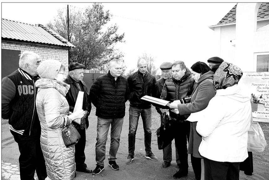
Ознакомление с проектом благоустройства территории проходило на месте планируемых работ.

Сегодня муниципалитет готовит для представления на конкурсный отбор в 2020 году три проекта. О двух газета уже рассказывала читателям: это строительство тротуара в жилом районе в поселке Усть-Кинельский и реконструкция водовода на улице частного сектора в поселке Алексеевка. Третий проект от Кинеля - благоустроительные работы в особой