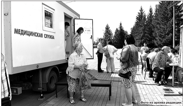
Акции, направленные на профилактику заболеваний, Кинельская больница стала проводить в регулярном режиме. На фото - «День здоровья» на площади Мира летом этого года.

На акцию «День здоровья» приглашают жителей, прикрепленных к Кинельской центральной больнице города и района. При себе необходимо иметь документ, удостоверяющий личность.