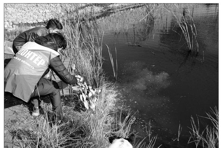
Для кинельских рыбаков - радость, для местной ребятни - забава.

Осеннее зарыбление озера Ладное муниципалитет проводит ежегодно. Для местных жителей это экологическое мероприятие становится настоящим событием. Ловля рыбы здесь - любимое развлечение и для взрослых, и для детей. А в этом году была заложена еще одна добрая традиция. На берегах озера гостеприимно встретили участников семейной рыбалки. О том, каким оказался «Ладный улов», газета уже рассказывала читателям. И вот в озерной фауне - долгожданное прибавление.