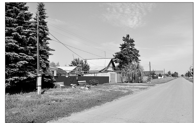
Современный поселок начинается с улицы Центральная.

Жители поселка приглашают всех на юбилей в эту субботу, 25 августа . Праздничное мероприятие состоится у здания бывшей начальной школы, начало - в 17 часов. Хорошее настроение принесут в атмосферу праздника творческие коллективы, особые поздравления прозвучат в адрес старожилов Горного.