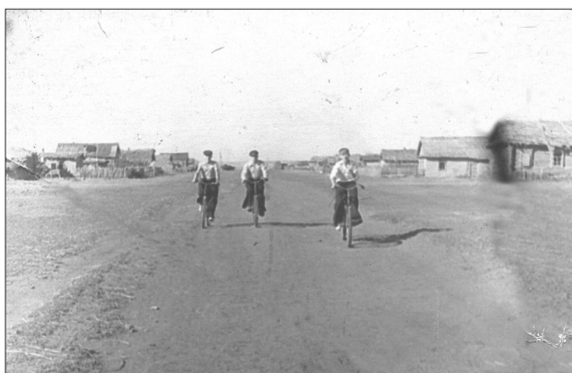
Горный в начале 50-х годов.

Акция «Корзина щедрости» продолжается. Если вы хотите поделиться урожаем со своего огорода, обращайтесь по адресу: г. Кинель, ул. Украинская, д. 34; телефон: 8(84663) 2-16-42. Если по каким-то причинам вы не можете доставить урожай в Центр соцобслуживания, позвоните по указанному номеру телефона и социальные работники организуют самовывоз, а также могут оказать помощь в сборе овощей и фруктов для передачи подопечным.