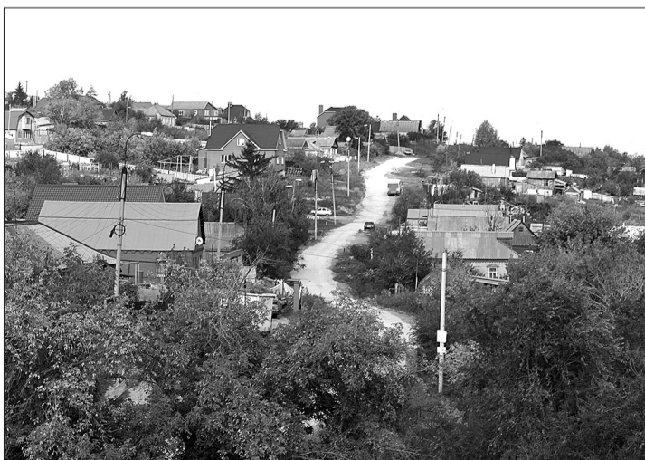
Извилистые улицы, тихая старина домов.