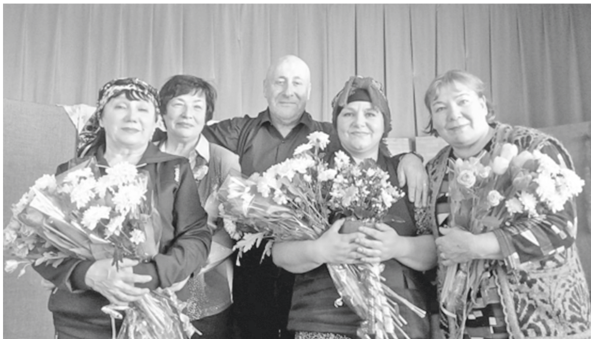
■ Цветы от благодарных зрителей.