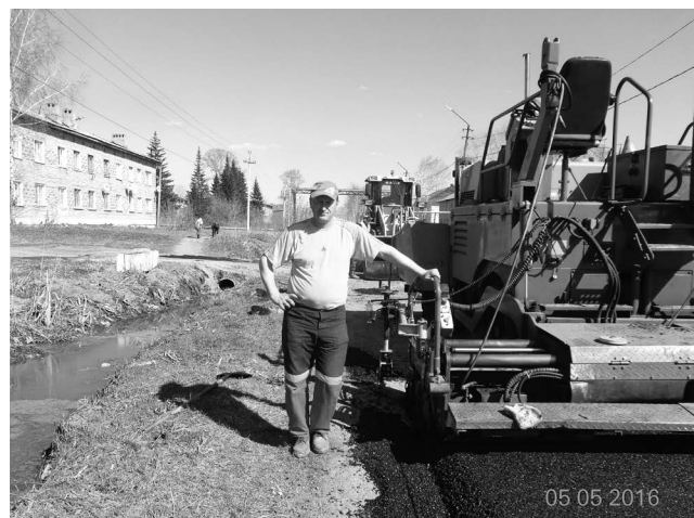
■ Новый асфальт