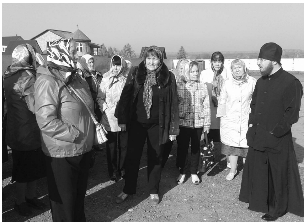
■ Паломники у церкви Распятия Господня

Первая церковь, которую мы посетили, – церковь Распятия Господня (Голгофа). Поднимаясь по крутой лестнице к кресту, кто-то из группы сказал: «Тяжело идти». А кто-то добавил: «Христу было труднее».