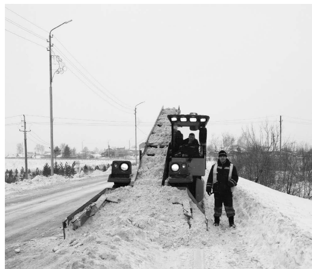
■ Уборка снега