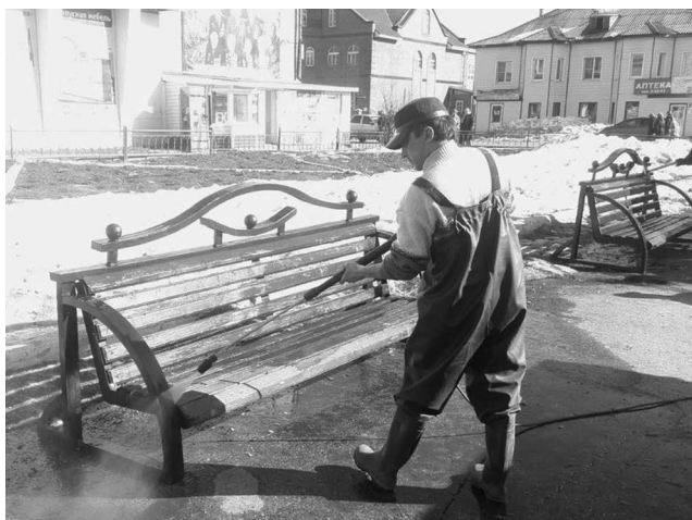
■ Скамейкам - чистоту