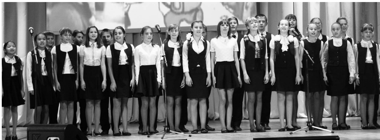
■ Выступление школьников