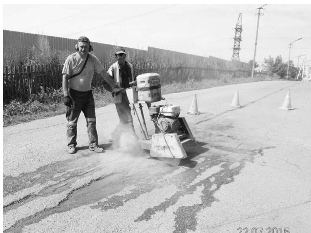
■ Ямочный ремонт