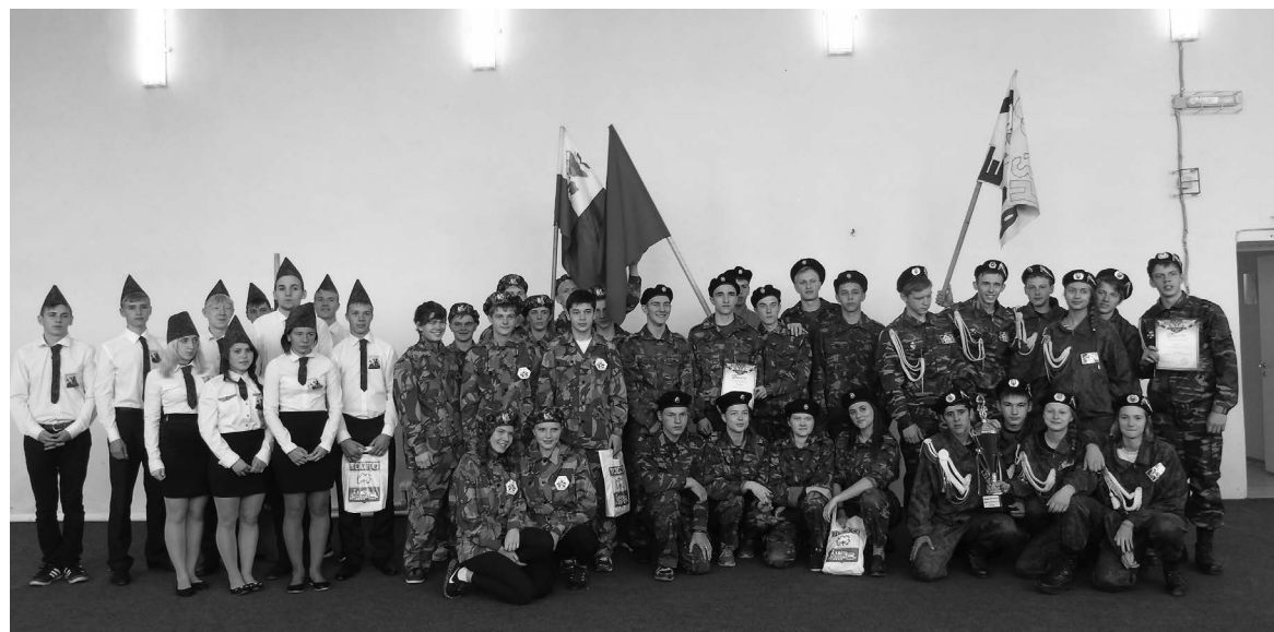
■ Участники Зарницы

С 30 сентября по 1 октября в поселке Кузель, на базе загородного оздоровительного лагеря «Романтик», прошла VI городская военно-спортивная игра «Зарница». Показать свою спортивную подготовку, ловкость, сопернический дух решились четыре команды: «Экстрим» - школа № 32; «Боевой расчет» - школа № 33; «Звезда» - школа № 34; «Дружина» - школа № 160.