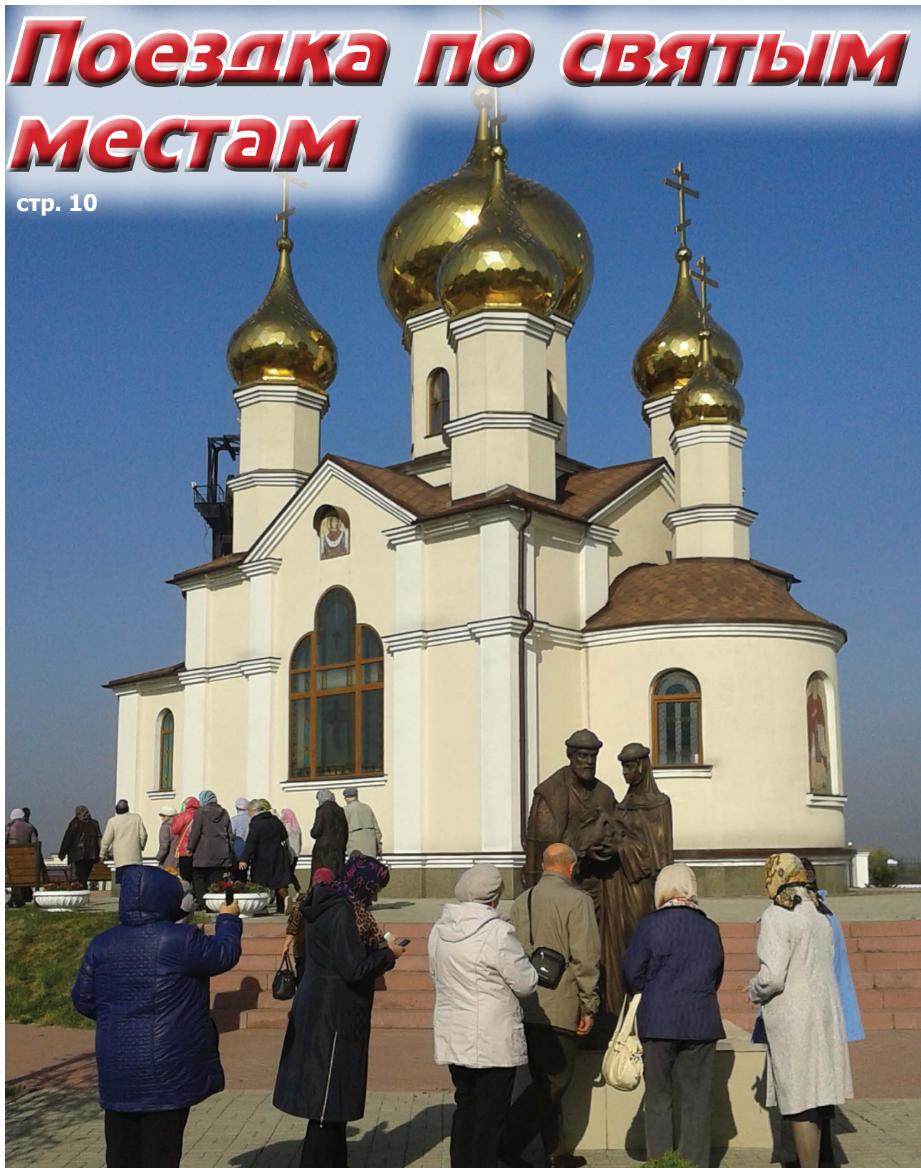
■ Церковь Сергия Радонежского.