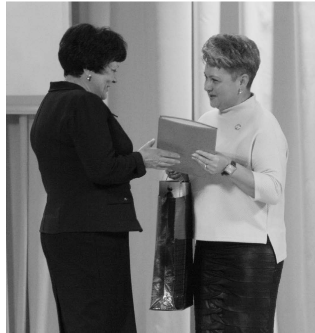
■ Церемония награждения

По итогам проведения муниципального этапа Всероссийского конкурса «Сердце отдаю детям» Благодарственным письмом администрации ТГО отмечены лауреаты конкурса: педагог дополнительного образования