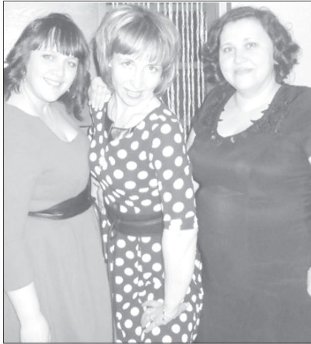
Коллектив бухгалтерии Архиповского сельского поселения

– Очень часто от людей, не знакомых с профессией бухгалтера, можно услышать: «От чего они устают? Сидят, кнопки на калькуляторе нажимают целый день». Но тот, кто не работал с цифрами и не составлял отчеты, никогда не поймет, что далеко не каждому человеку под силу освоить эту профессию и видеть за колонками и рядами цифр конкретные результаты