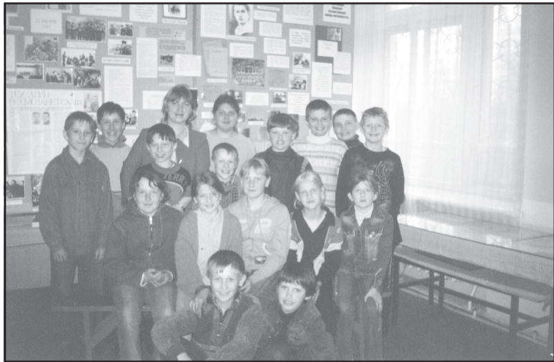
Школьники – постоянные посетители районного музея