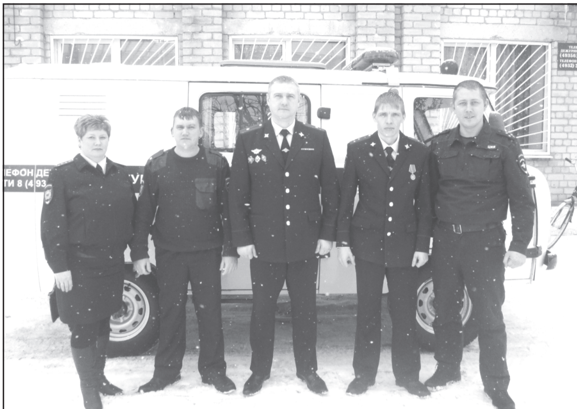
Коллектив участковых уполномоченных ОП № 11

Начальник отделения участковых уполномочен-