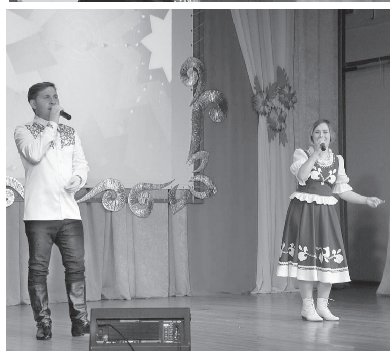
Моменты праздничной встречи.

ского района по итогам десяти месяцев 2020 года.