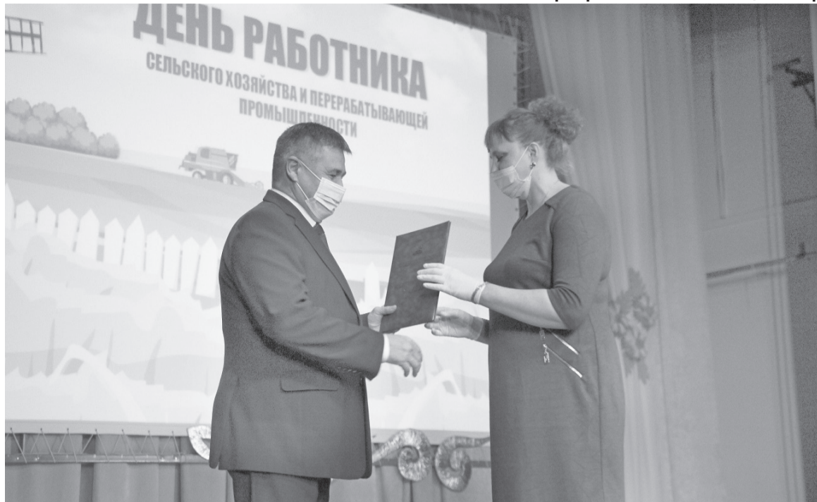
На сцене районного Дома культуры наградили лучших тружеников сферы.

В районном Доме культуры состоялась встреча, посвящённая празднованию Дня работника сельского хозяйства и перерабатывающей промышленности