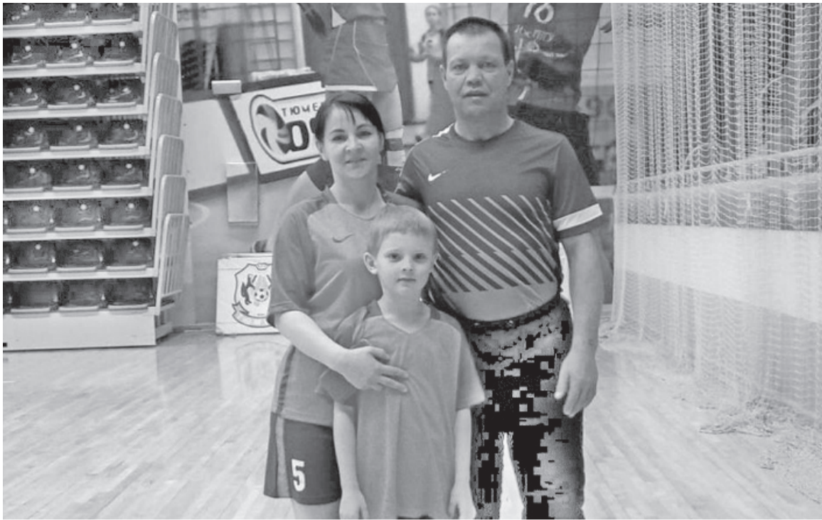
Пример здорового образа жизни детям подают родители.