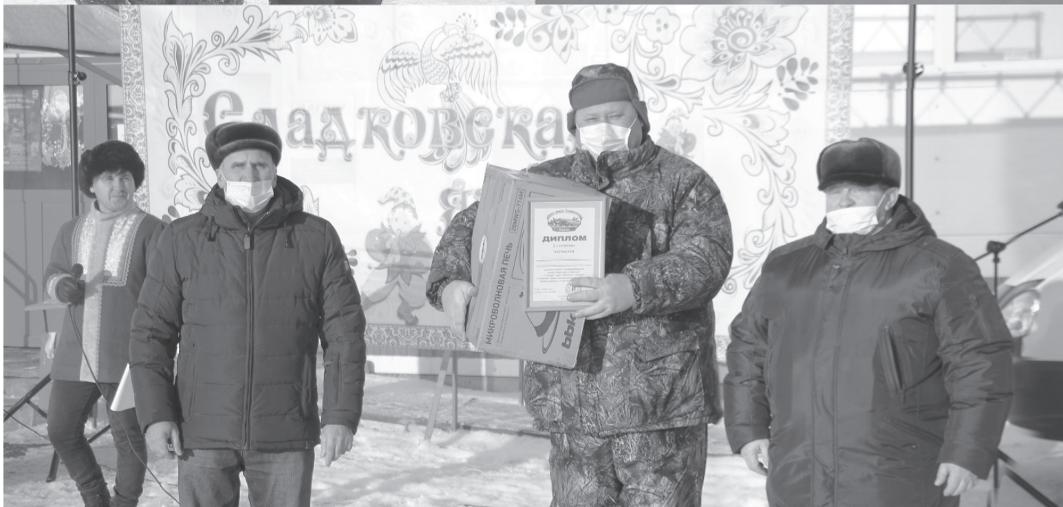
Традиционная районная ярмарка прошла по новым правилам.