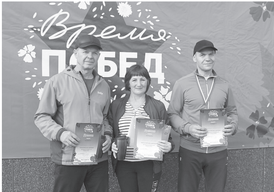
Команда «Ветераны-50+» стала победителем в своей группе.

В минувшую субботу в каждом сельском поселении в рамках областного «Дня здоровья» прошли спортивные мероприятия