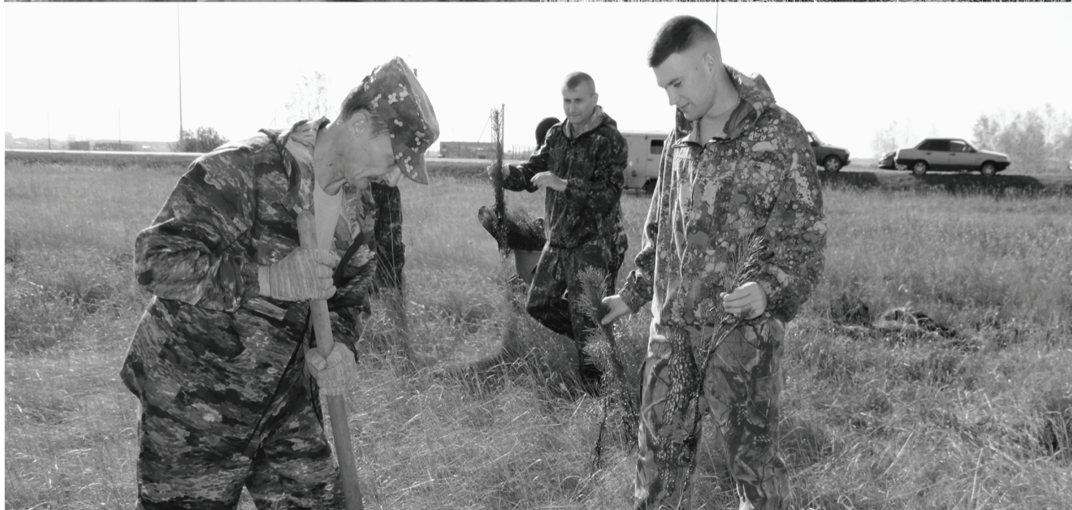
В мероприятии приняли участие представители разных ведомств и структур района.