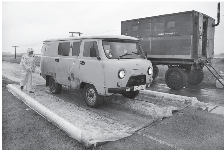
КПП предотвращают распространение вируса.