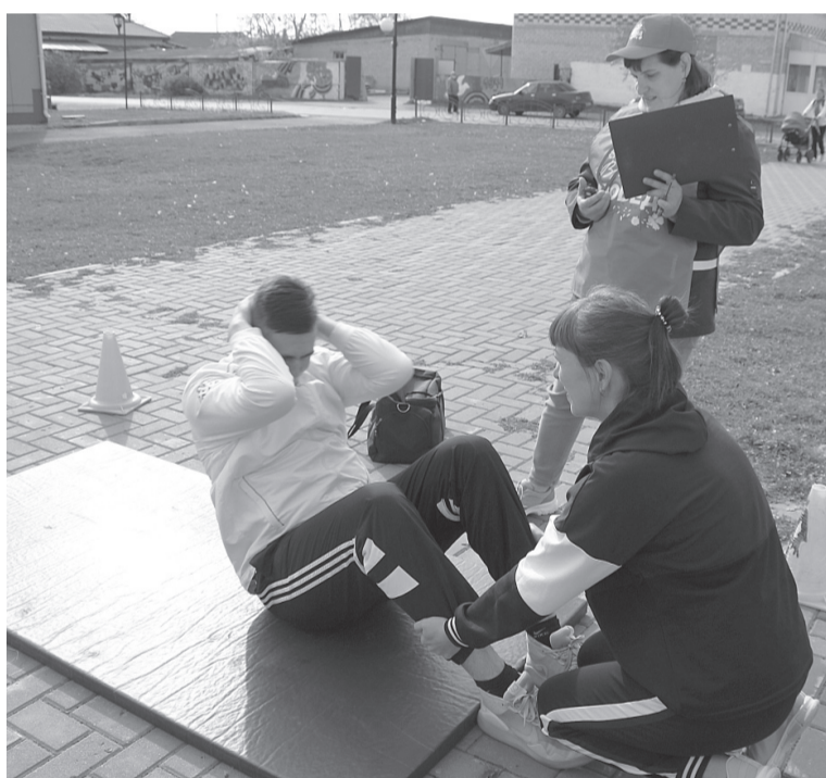
Момент спортивных состязаний.

Испытания участникам достались, на первый взгляд, несложные. Но, чтобы получить большое количество баллов, пришлось приложить усилия. Набивание футбольного мяча, бросание баскетбольного мяча в кольцо, дартс, рывок гири, подтягивание из виса на высокой или на низкой перекладинах,