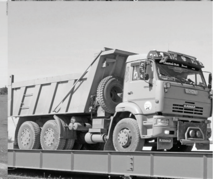
Техника и сотрудники Маслянского ДРСУ готовы к жаркому сезону дорожных работ.