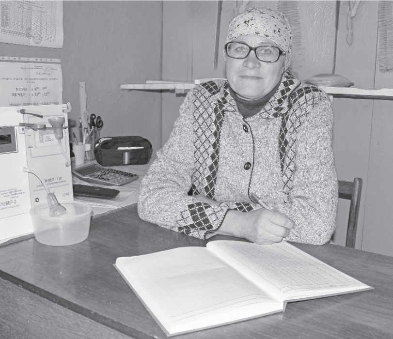
Н.Фролова: «Главное в нашей работе – люди».

Людмила ВЕРХОШАПОВА