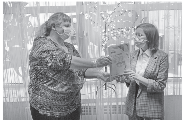
Сотрудники библиотеки вручили дипломы школьницам.

Людмила ВЕРХОШАПОВА