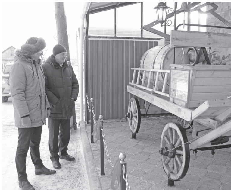
Установлен макет пожарного хода.

Огнеборцы установили символический памятник из истории пожарной службы