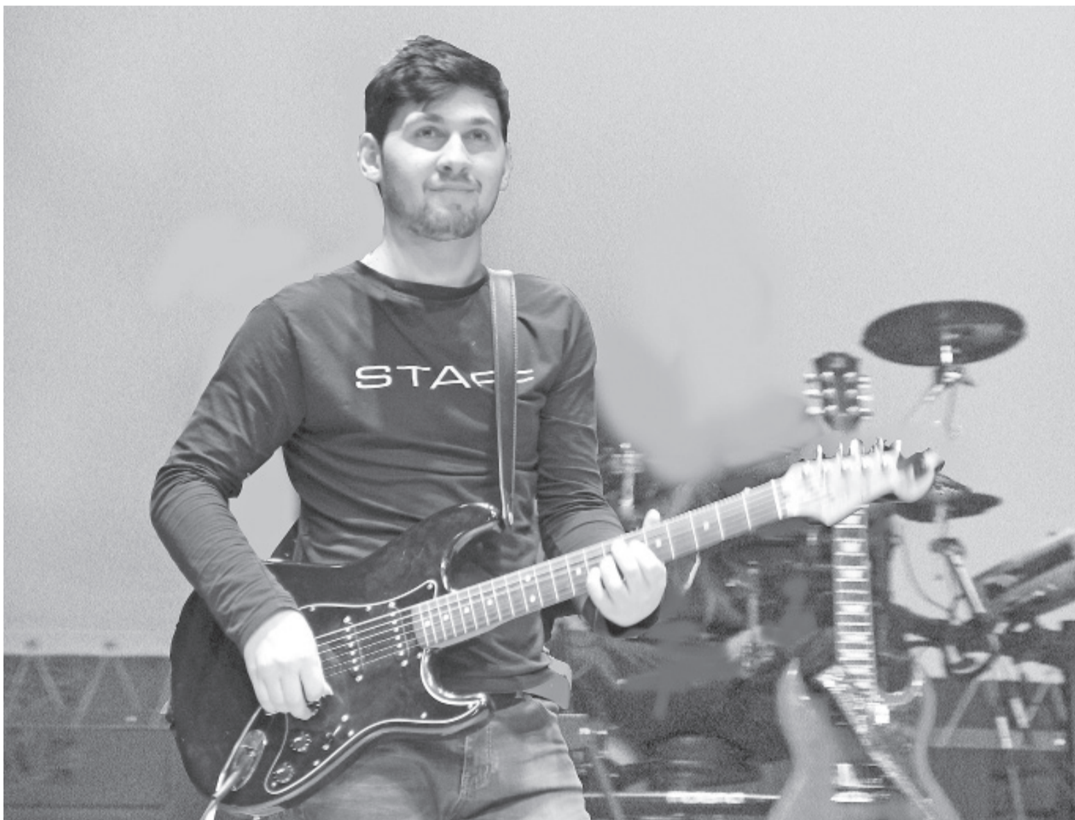
Творчество сладковского артиста отмечено на высоком уровне.