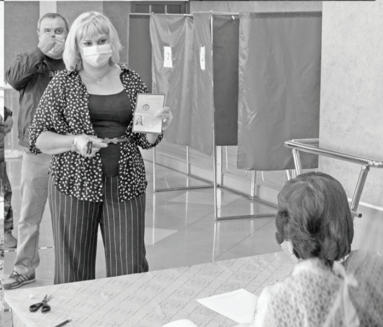
Голосование по поправкам в Конституцию РФ проходит с соблюдением необходимых мер предосторожности.