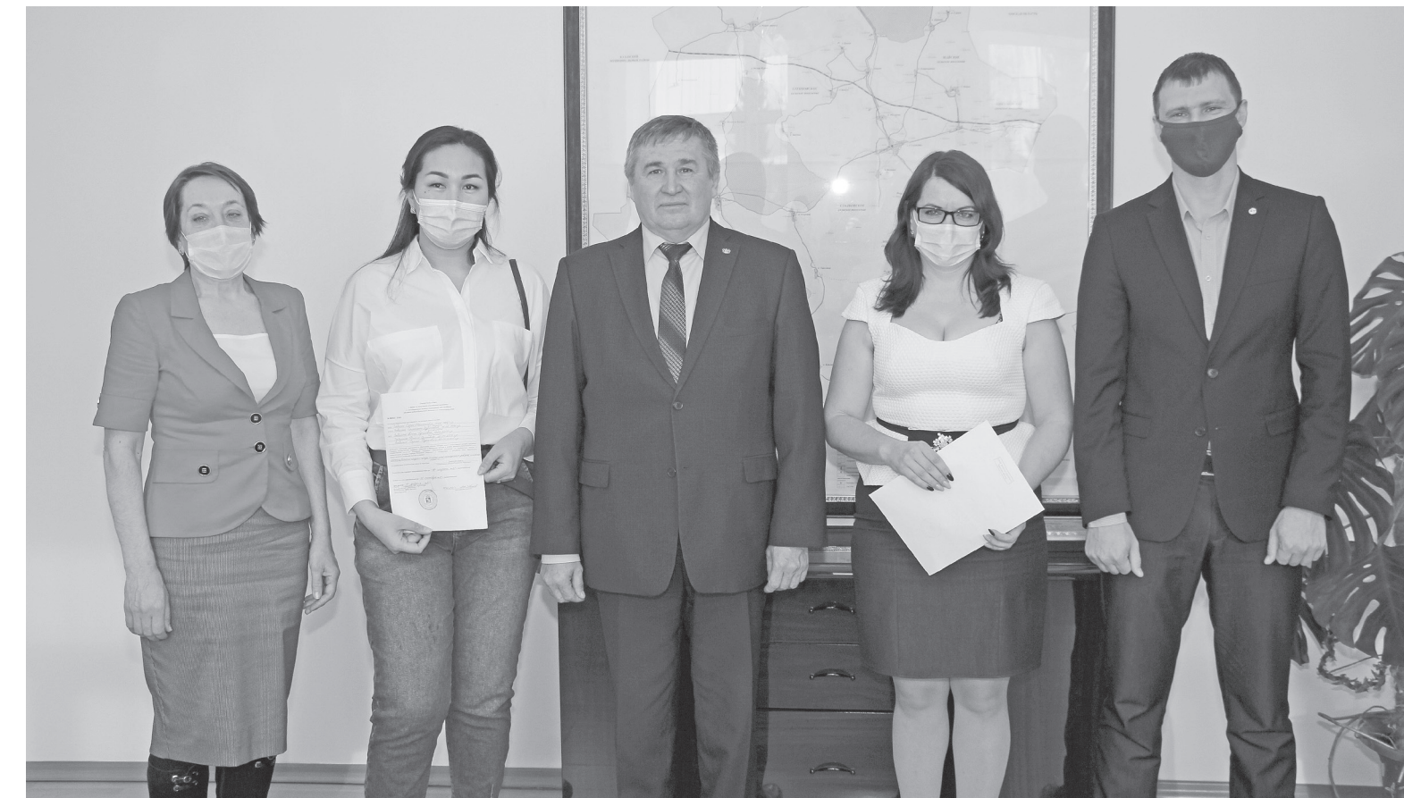
Глава района вручил важные документы сладковским семьям.