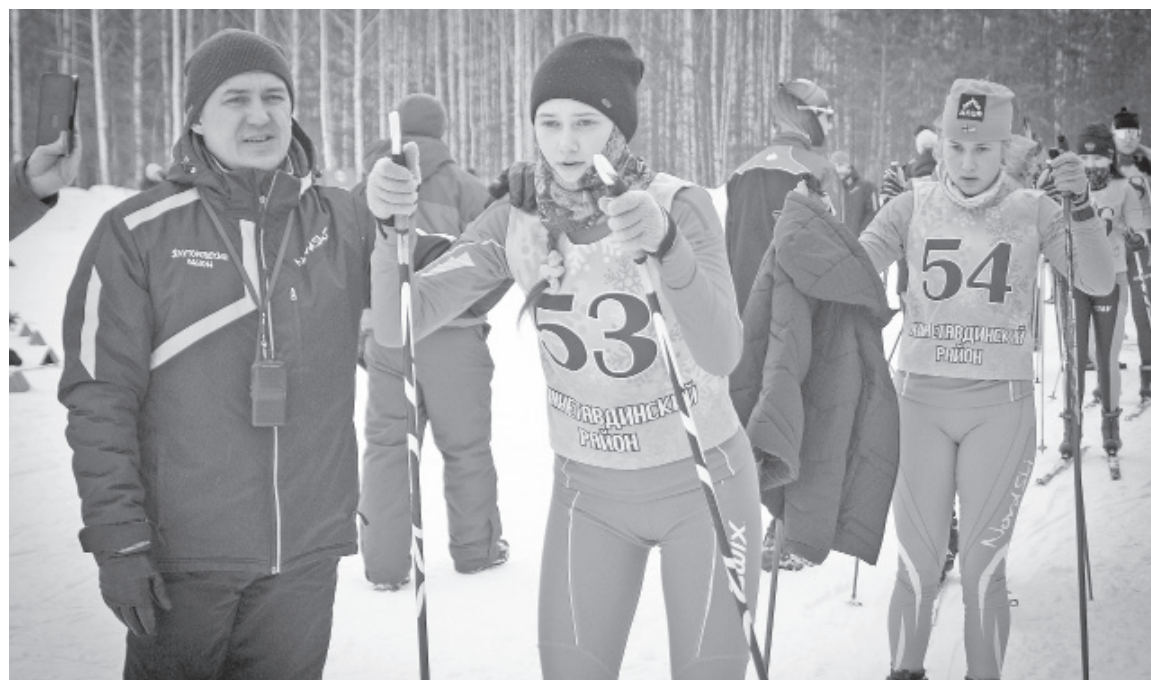
На региональных состязаниях наши спортсмены блеснули мастерством.

Спортсмены района успешно выступили на региональных мероприятиях