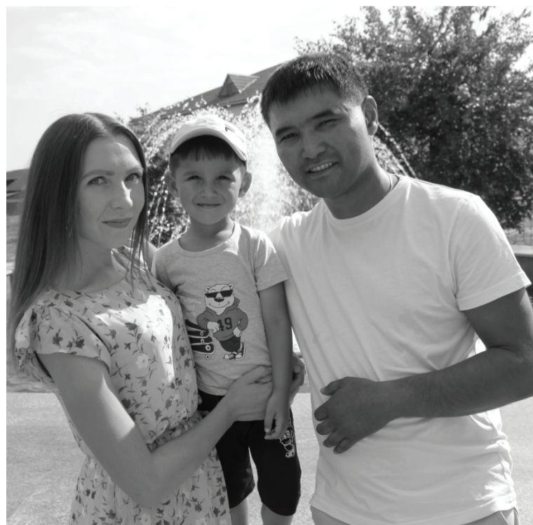
Молодая семья с уважением относится к национальным традициям.