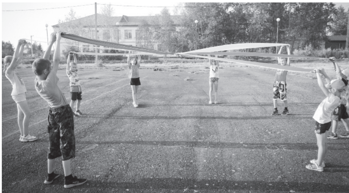
День физкультурника прошёл весело и интересно.

Накануне праздника в сельских поселениях на вечерних спортивных площадках состоялись различные мероприятия, посвящённые этой дате