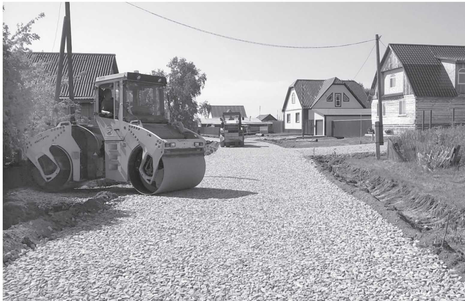
На одной из улиц посёлка появилась новая дорога с твёрдым покрытием.