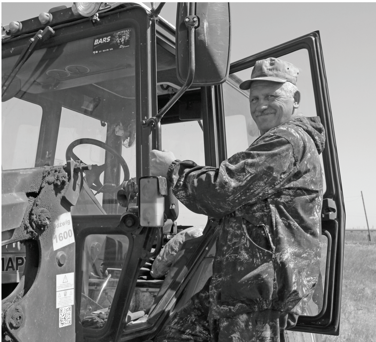
Механизатор Михайловского отделения «Таволжан» – в числе лучших в области.