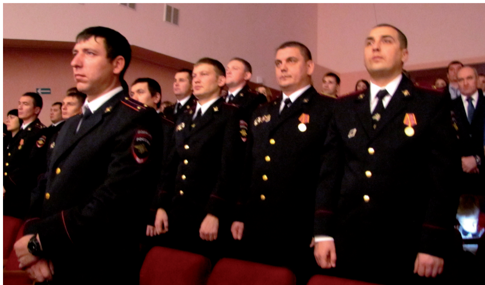
Минута молчания в память о тех, кто отдал себя служению Закону.