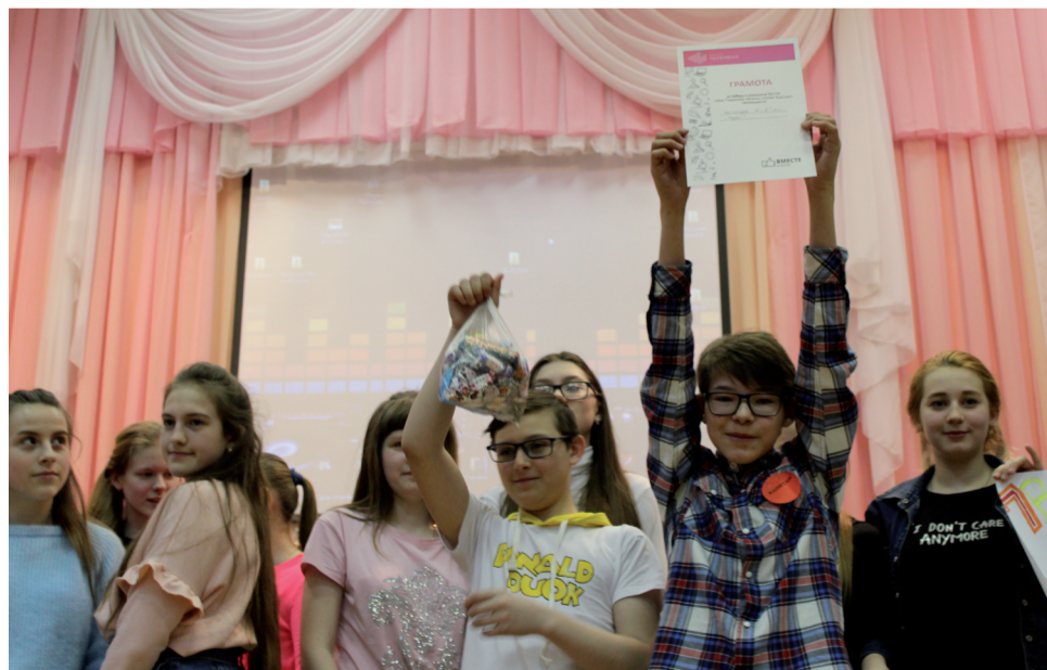
Победители - 7 «В».