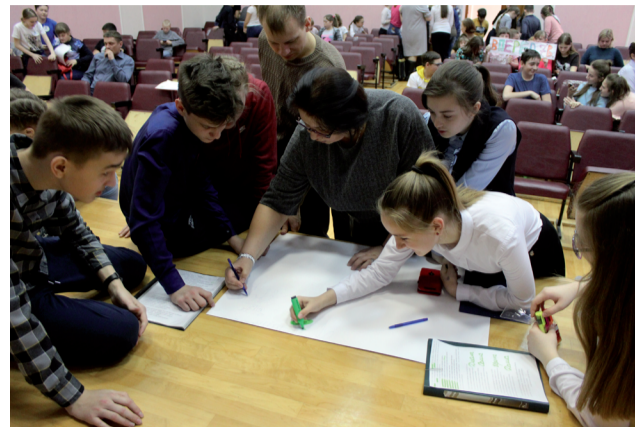
Рисуют проект Туртаса.

Затем команды собирали в одну завершённую мозаику пазлы с изображением отдельных достопримечательностей. За правильно названный населенный пункт, где находятся изображаемые памятники, команде начислялись дополнительные баллы. И более сложное задание, на реализацию которого каждая команда выдвигается по чистому листу ватмана. На нем надо изобразить будущее своего поселка, каким оно ребятам видится через 10-15 лет. Рисунки могут дополняться устными рассуждениями. Команды, вооружившись фломастерами, сосредоточились над столь творческой работой. В это время вовсю разошлись болельщики, оглушая зал какофонией «кричалок». Наконец, команды в полном составе одна за другой приглашаются на сцену для защиты своего проекта. У одних Туртас - город с современной развитой инфраструктурой, у других - город отдыха и развлечений, а у кого-то - центр образования и бизнеса. В своих мечтах ребята из 7 «Б» озаботились как о взрослых, запланировав им различные бутики, кафе и автосалоны, так и о детях, не забыв о развлекательных днях площадках. Но особую заботу о детях будущего про-