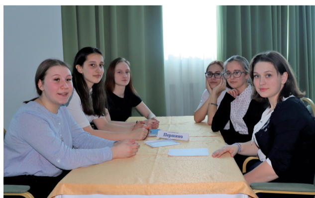
Победители - команда Першинской школы.

Лишь полтора балла отделили команду школы из пос. Демьянка от победителей, в прошлом году разрыв между командами был два балла. Они заняли почетную вторую ступень пьедеста-