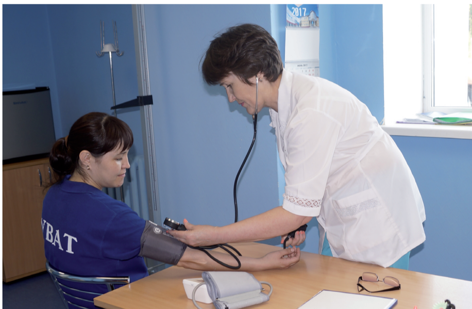
Для слаженной работы спортивного врача, спортсменов и тренеров в ФОК «Иртыш» созданы комфортные условия.