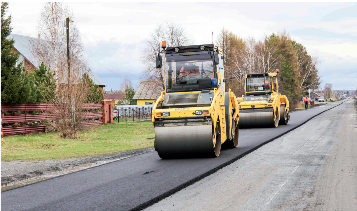
Отремонтировано 12 километров дорог местного значения на сумму 40 миллионов рублей.

Структурные изменения в 2018 году начались еще в одной жизненно важной для района отрасли - жилищно-коммунальном хозяйстве. Не секрет, что все три наши муниципальные предприятия уже много лет сталкиваются с критическими для себя проблемами: изношенность сетей, долги прошлых лет, неплатежи за поставленные ресур-