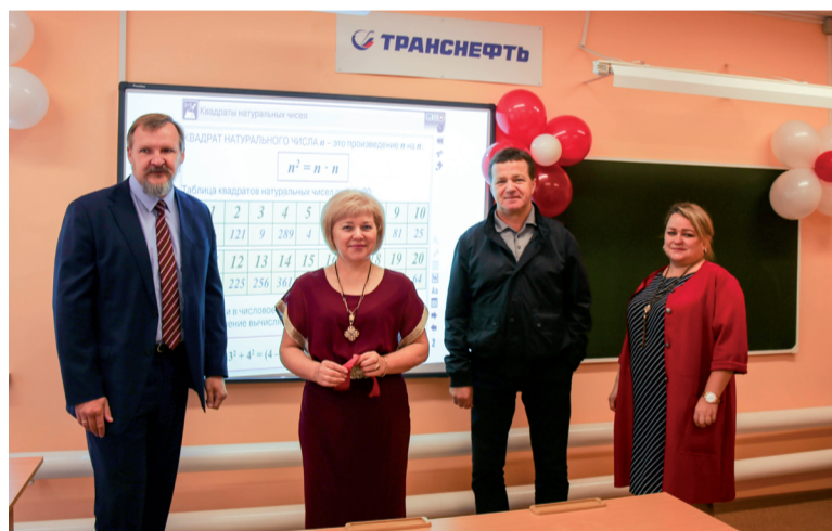
В Мугенской школе отремонтированы кабинеты физики, химии и математики на средства ПАО «Транснефть».