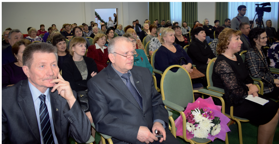
Жители района поздравляют музей с юбилеем.